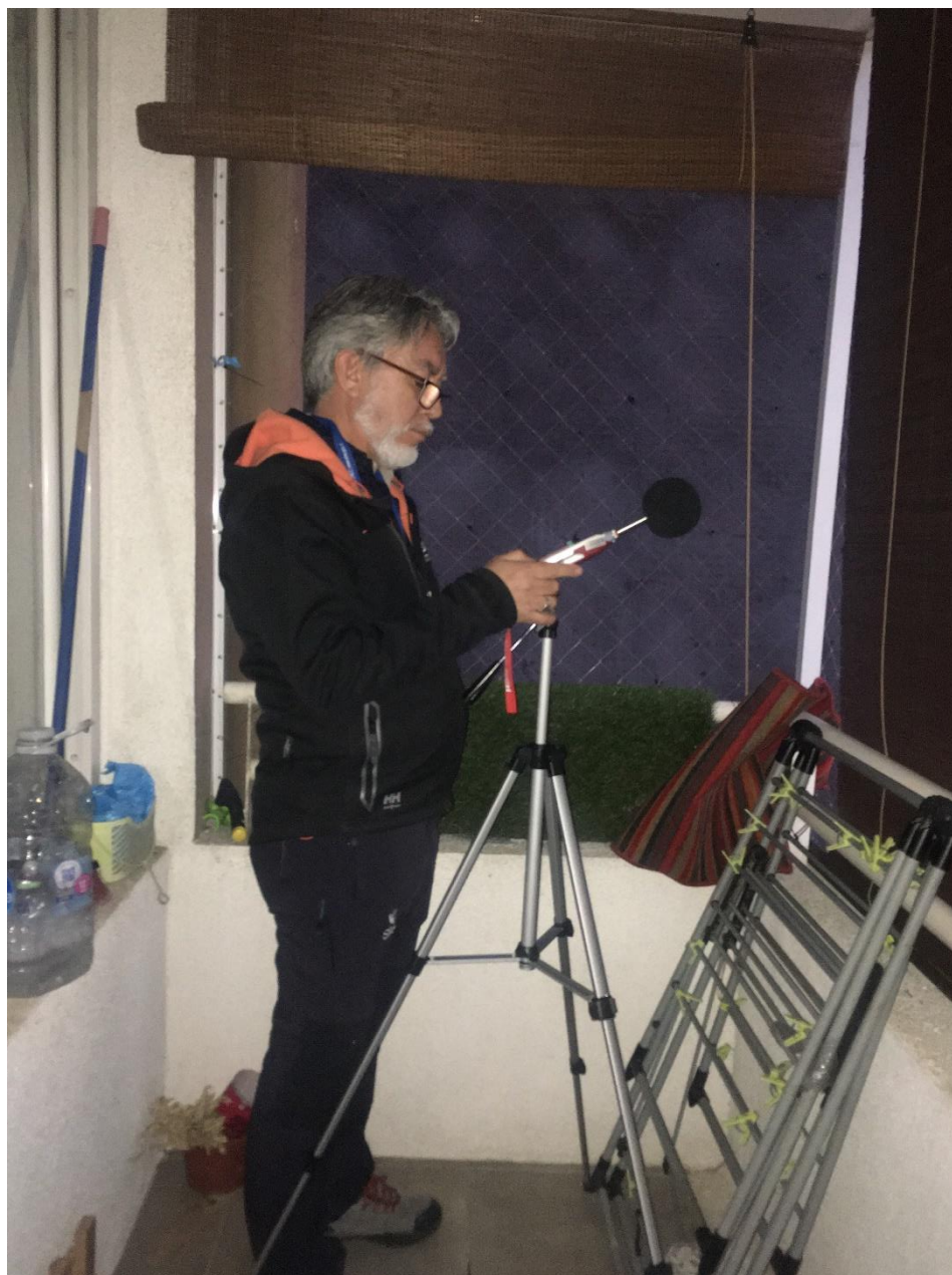
Fotografía 1. Fecha: 05-10-2023

Descripción Medio de Prueba: Medición externa en balcón de vivienda, el cual se encuentra orientado hacia la fuente emisora