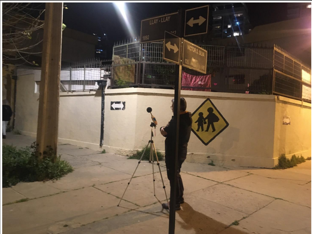
Fotografía 3. Fecha: 05-10-2023

Descripción Medio de Prueba: Vista del sitio de medición de ruido de fondo.