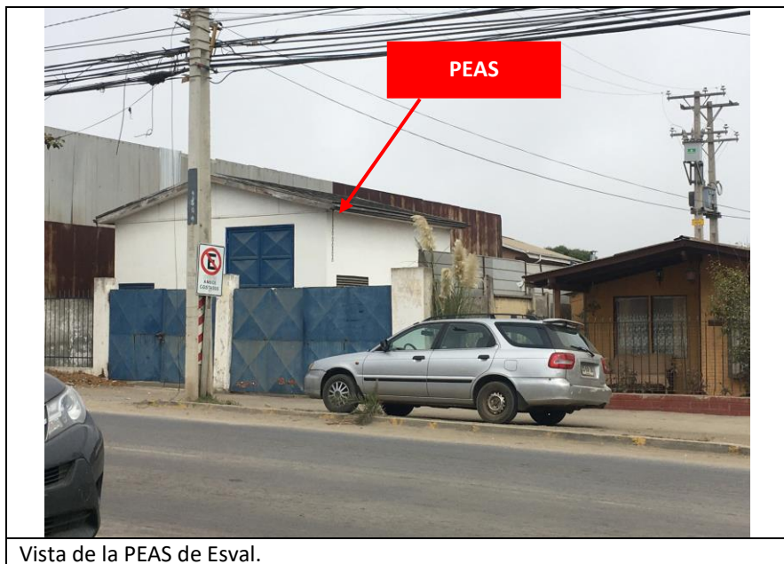
Vista de la PEAS de Esval.

El lugar denunciado corresponde un Planta Elevadora de Aguas Servidas ("PEAS"), ubicada dentro de una caseta y que pertenece a la empresa Esval S.A.