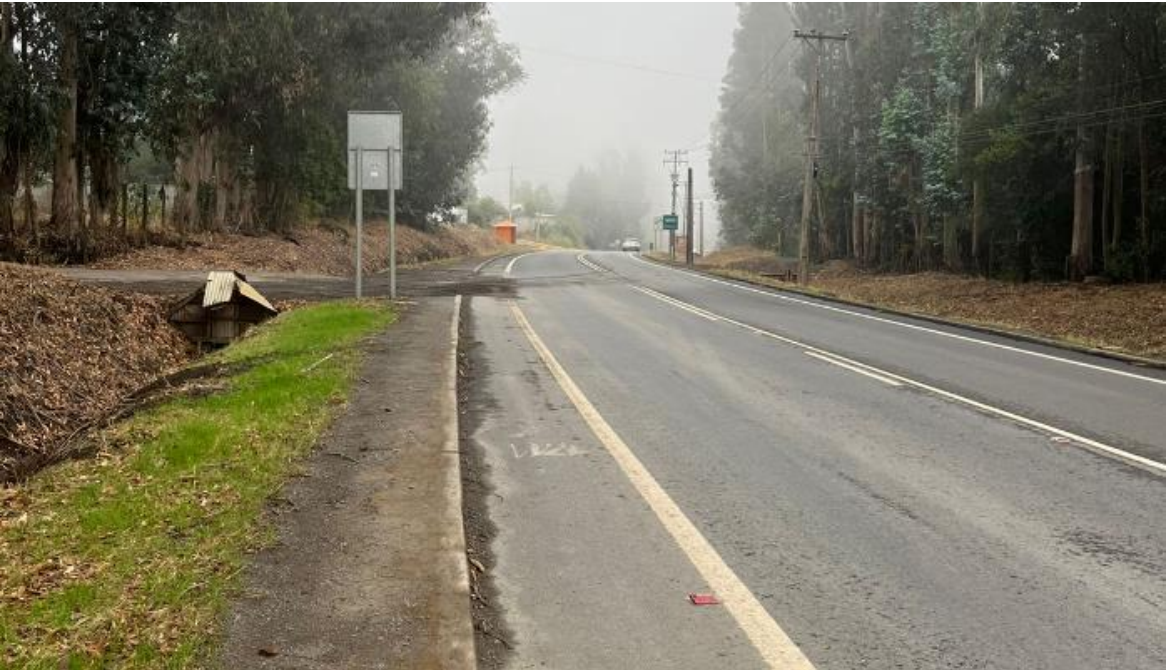
Figura 1. Acceso a la Ruta 156 del Proyecto “Aumento de extracción de áridos, cantera Fundo Palco Chuponal”

A la fecha, ya habiendo cumplido el plazo, la factibilidad perdió su validez, debiendo el interesado reingresar los documentos correspondientes para su renovación en este Servicio.