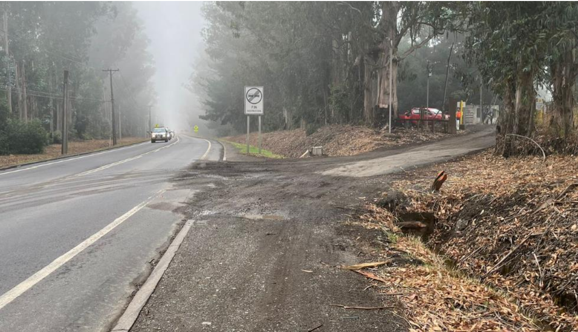
Figura 2. Acceso a la Ruta 156 con falta de mantención y con evidente arrastre de material a la calzada.

No se observa la implementación del sistema de lavado de neumáticos y carrocería, manteniendo la misma observación realizada en la fiscalización anterior.