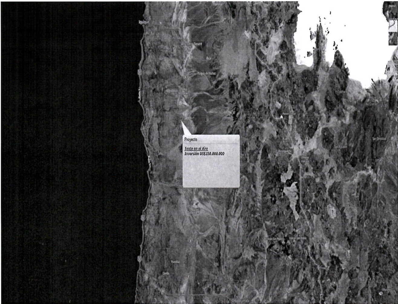
Figura 1. Mapa de ubicación local