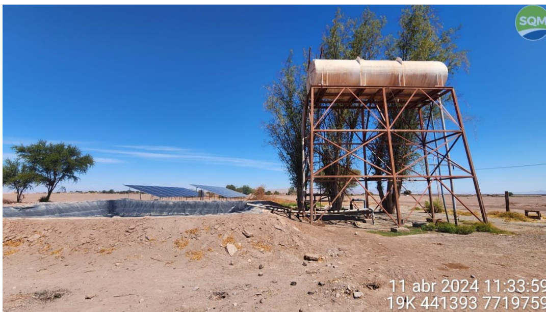
Imagen 3. Pozo n°2, y tranque acumulador de agua.