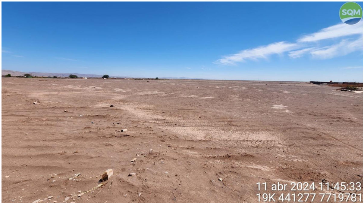
Imagen 1. Superficie del predio comunitario de la A.I.A. Juventud del Desierto, donde se desea levantar el centro de producción de forraje.