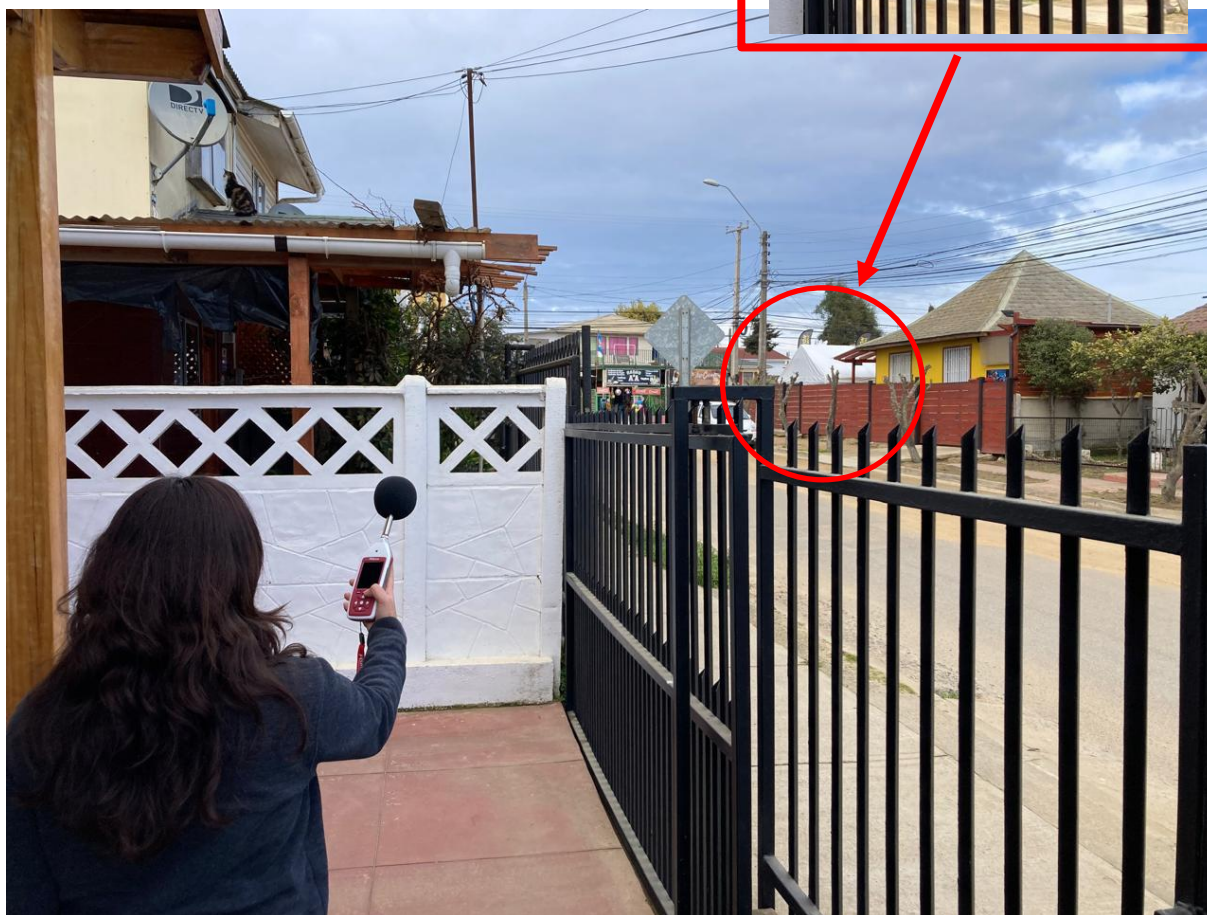
Fotografía 2. Fecha: 23-07-2023

Descripción Medio de Prueba: Medición externa en patio delantero de la vivienda del receptor "1", orientado hacia la fuente emisora, la cual se encontraba en operación, dentro de una carpa cerrada localizada en el patio del establecimiento, con música festiva asociada a los entrenamientos.