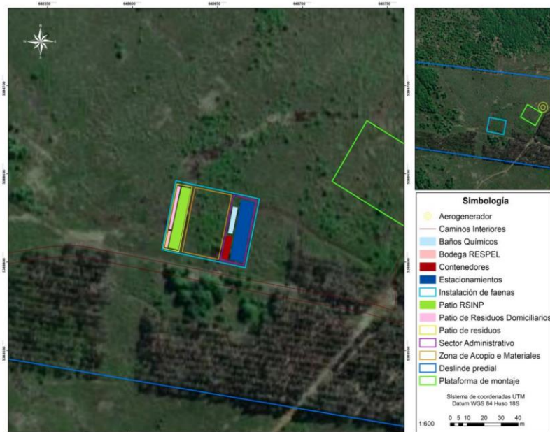
Figura 2-14. Componentes de la Instalación de Faenas