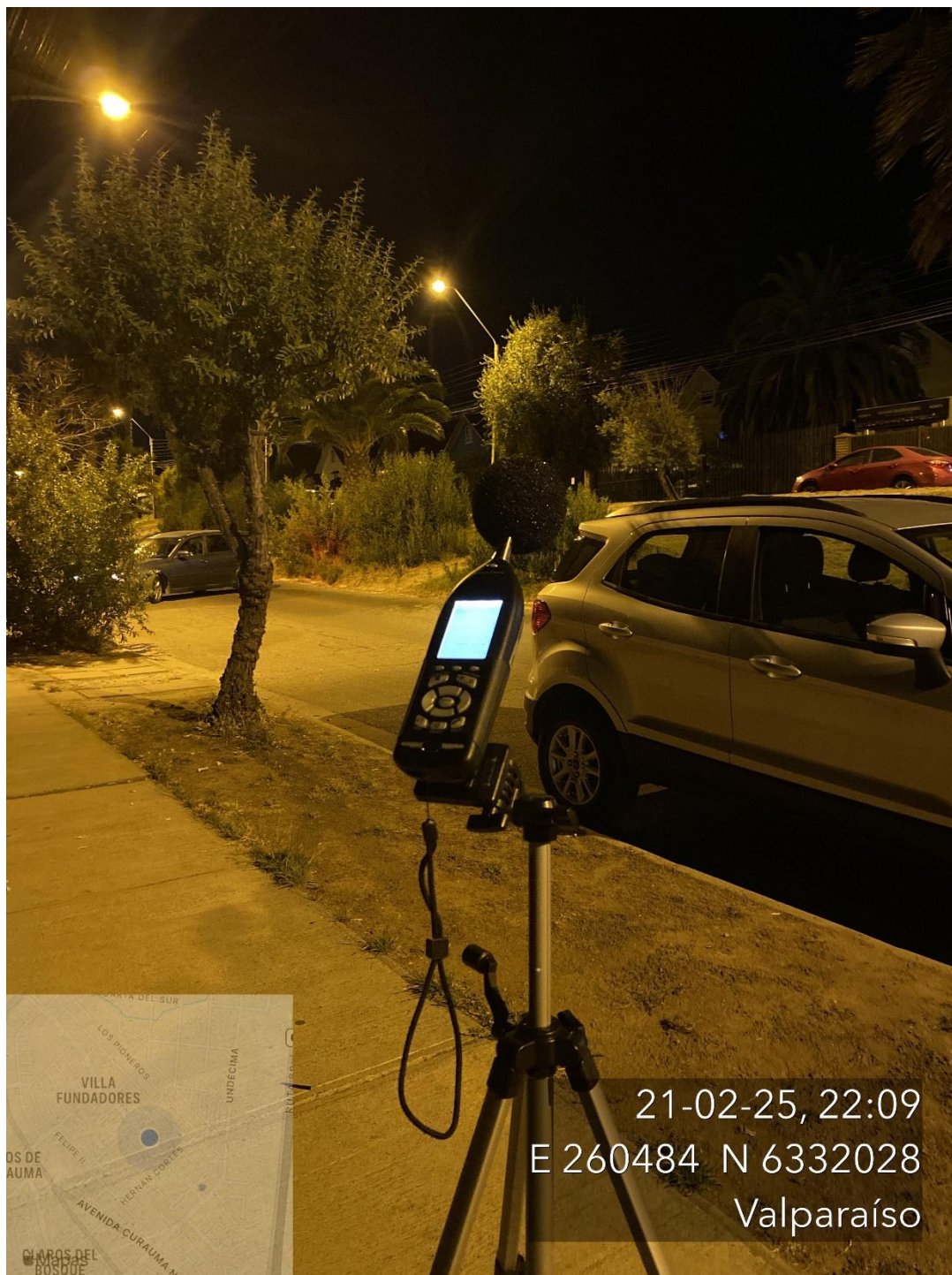
Fotografía 2. Fecha: 21-02-2025

Descripción Medio de Prueba: Punto 2 de la medición ruido de fondo