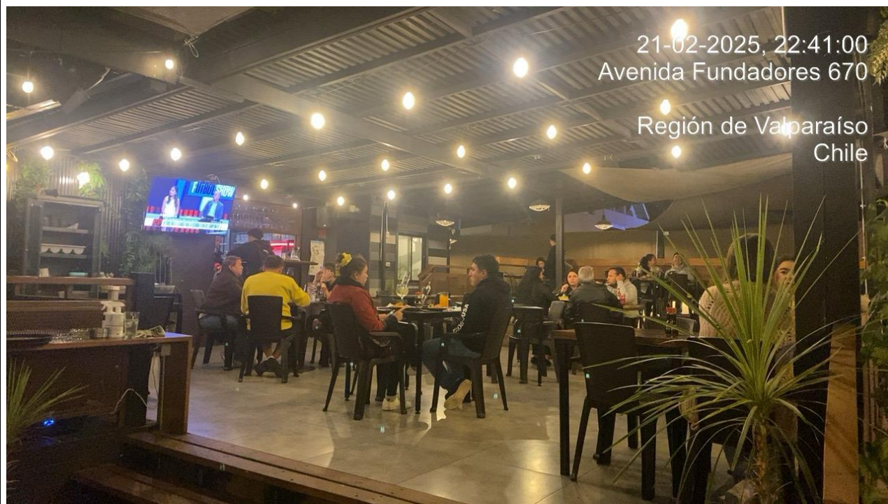
Fotografía 3. Fecha: 21-02-2025 Descripción Medio de Prueba: Fuente emisora