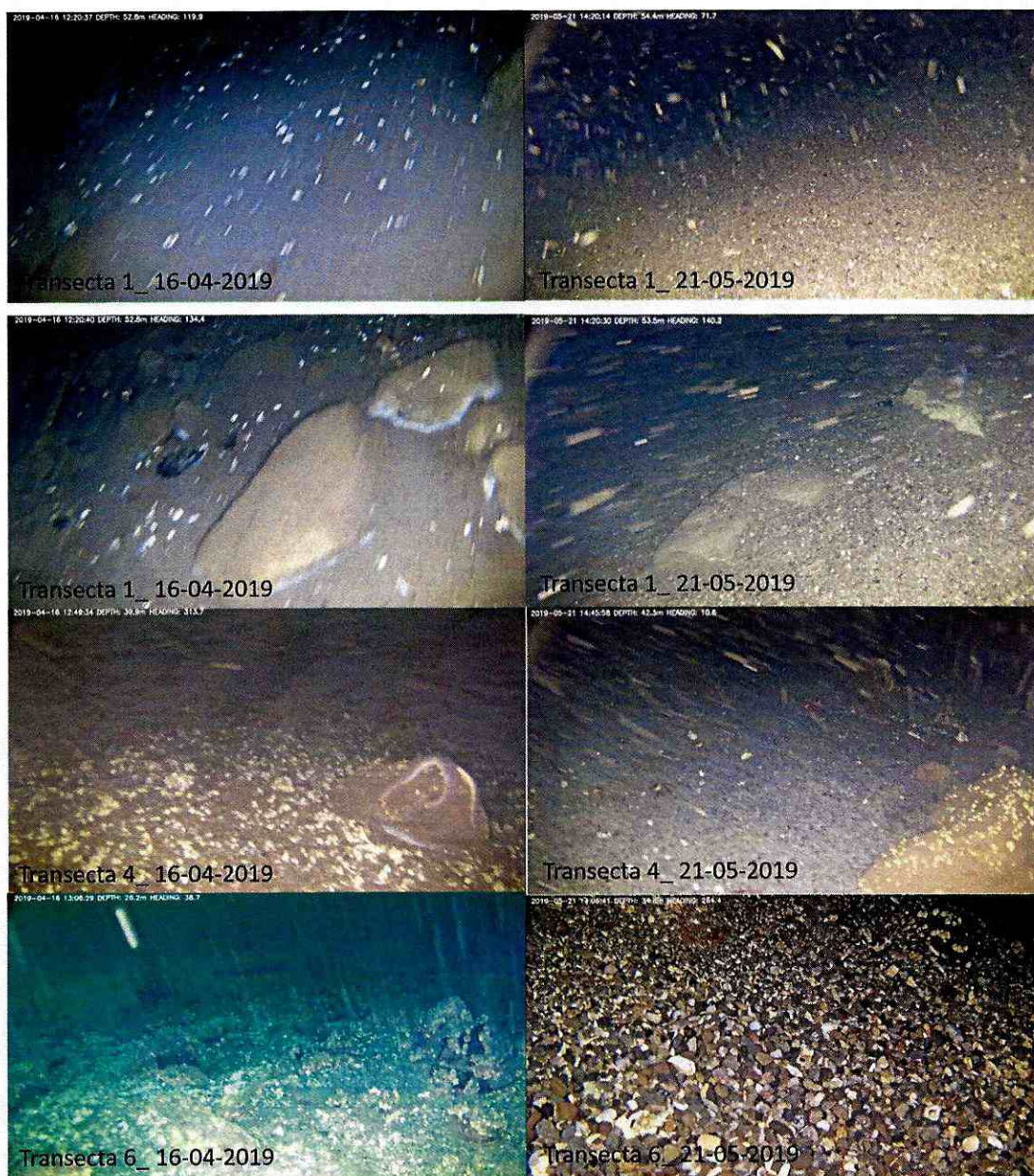
Imagen N°2. Vista comparativa de sustrato marino entre filmaciones obtenidas en INFA "oficial" realizada el 16-04-19 e INFA "interna" realizada con fecha 21-05-19.

8. Los antecedentes antes expuestos permitirían advertir el incumplimiento al artículo 8 bis del D.S. N°320/2001 del Ministerio de Economía, Fomento y Reconstrucción ("Reglamento Ambiental para la Acuicultura", RAMA), el cual ha sido incluido como normativa ambiental aplicable en virtud del considerando 5.1., literal a) de la RCA N°151/2003, y los considerandos 4.4.1 y 5.1.1.2 de la RCA N°079/2010. En efecto, el artículo antes descrito establece que "El uso de mecanismos físicos, productos químicos y biológicos, o la realización de cualquier proceso que modifique las condiciones de oxígeno del área de sedimentación, así como las actividades que resuspendan el sustrato, el arado, arrastre, aspirado o extracción del material sedimentado proveniente de centros de cultivo, sólo podrán ser llevado a cabo previa autorización por resolución fundada de la Subsecretaría" .