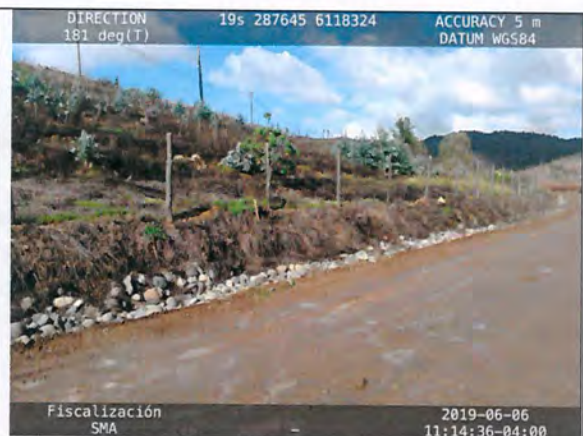
Figura N° 12