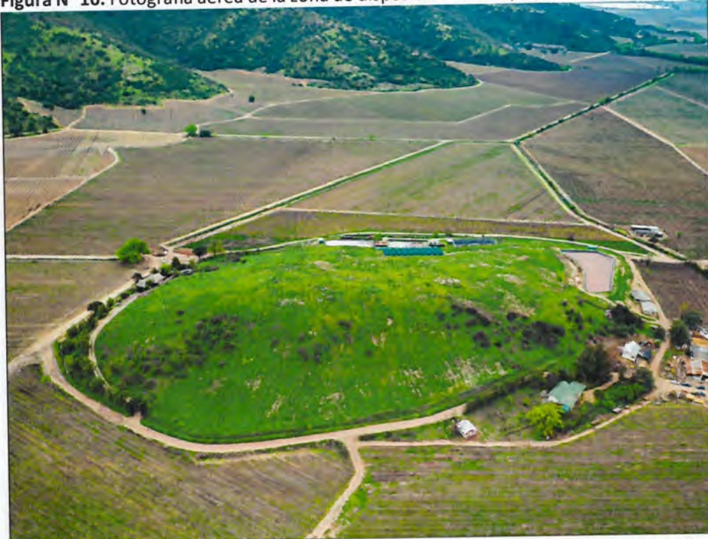
Figura N° 10. Fotografía aérea de la zona de disposición de riles, de fecha 25 de septiembre de 2018.

En el archivo adjunto es posible observar la información relativa a fecha de captura y georreferencia.