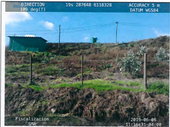
Figura N° 11