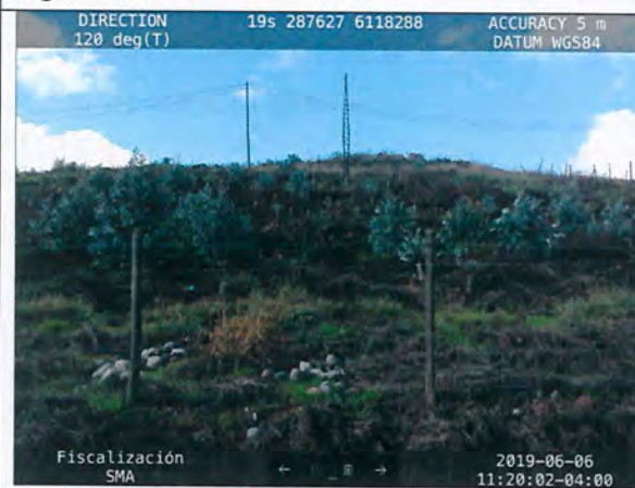
Figura N° 13