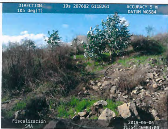
Figura N° 17