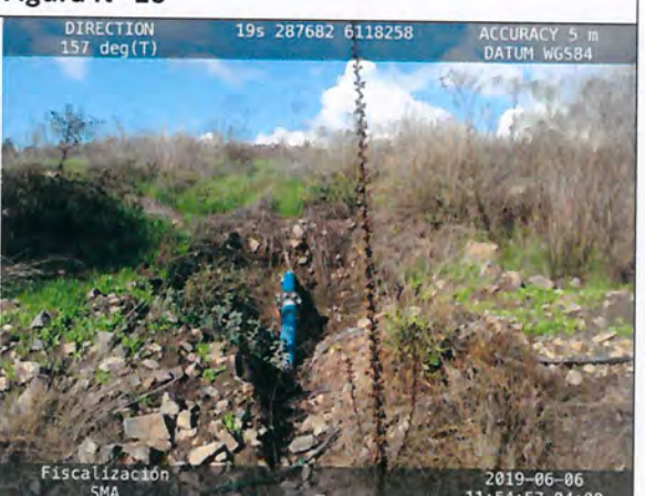
Figura N° 18