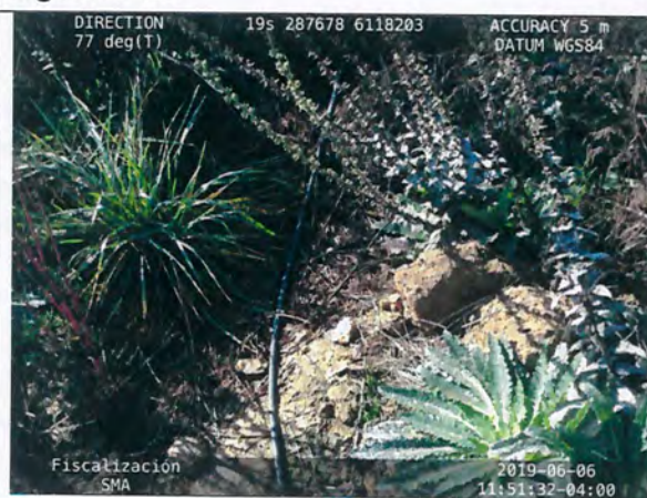
Figura N° 15