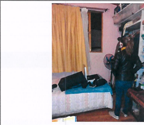
Fotografía N° 1