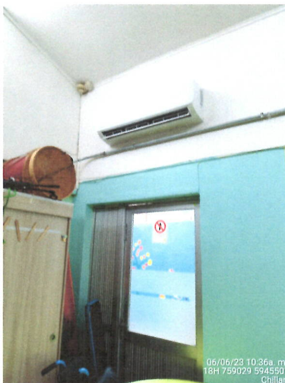
Equipo eléctrico habilitado