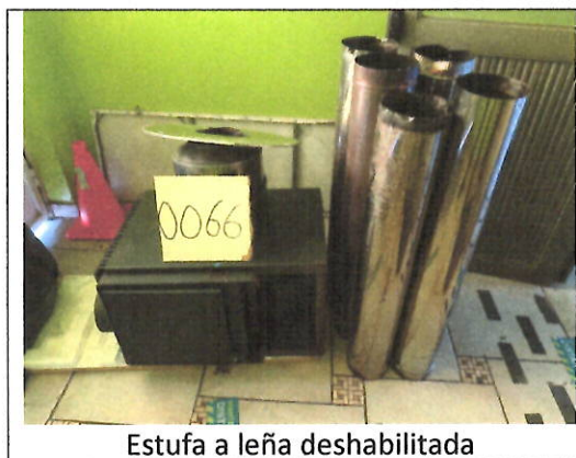
Estufa a leña deshabilitada