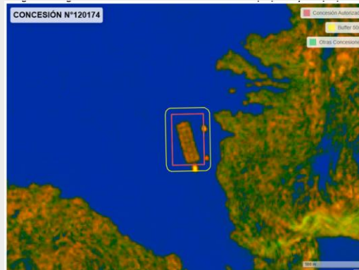
(2) Entre el 01/04/2025 y el 31/05/2025