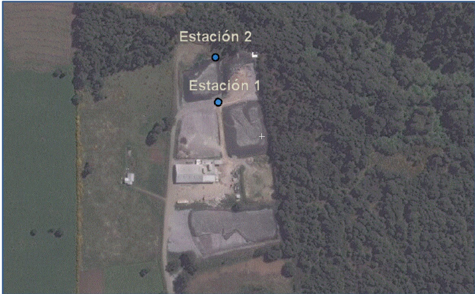
Figura 4. Estaciones (Fuente: Elaboración propia en imagen ArcGis Explorer).