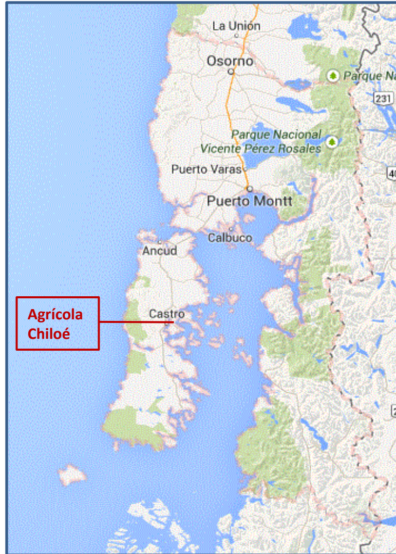
Figura . Mapa de Ubicación Regional.