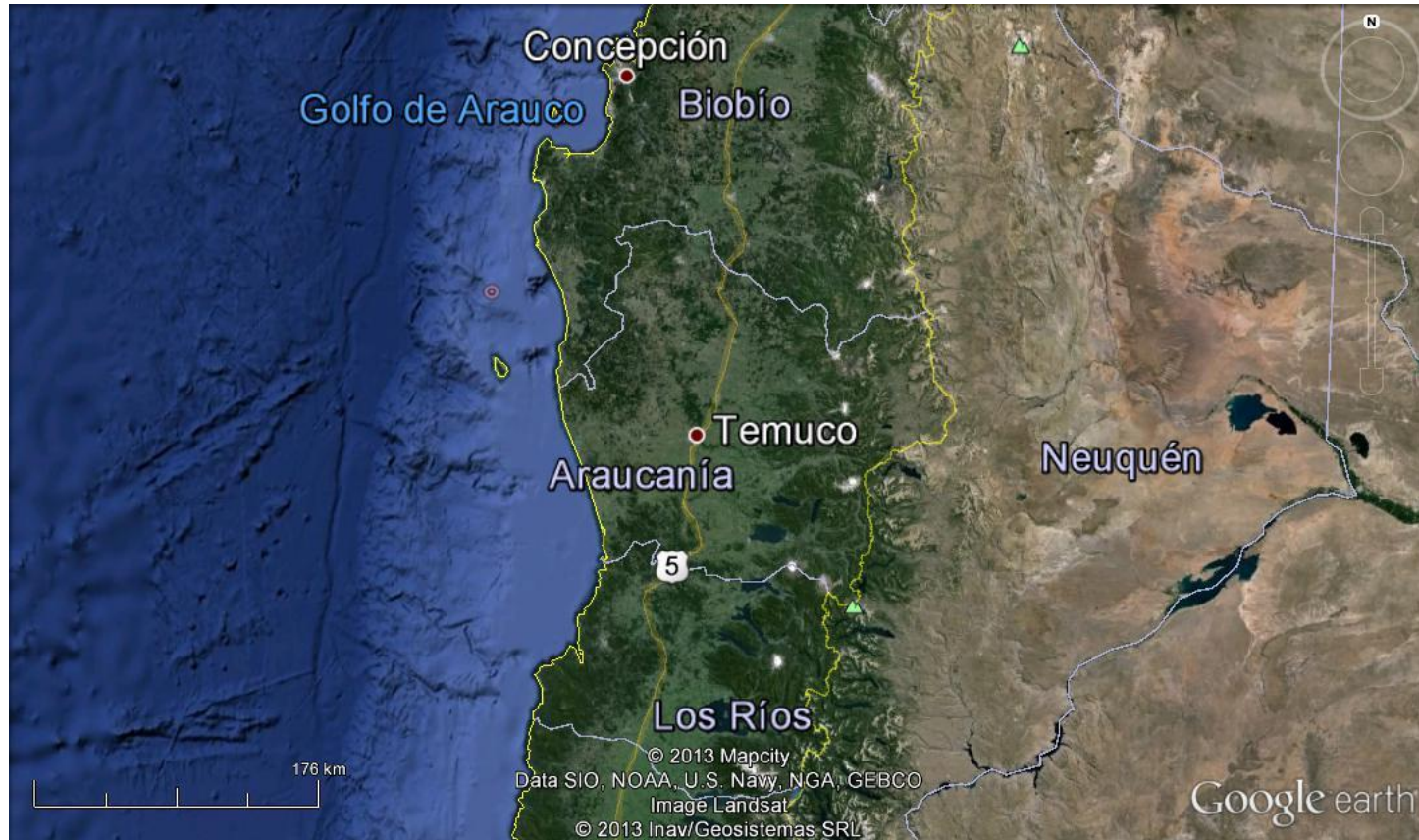
Figura 1. Mapa de Ubicación Regional (Fuente: Google Earth, 2013).