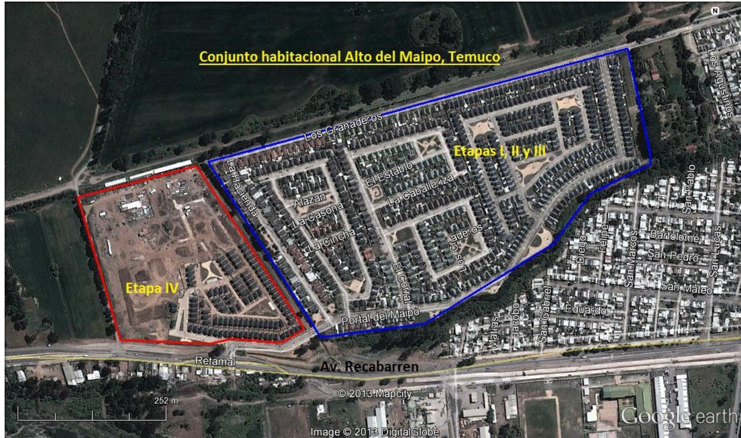
Figura 3. Layout del Proyecto (Fuente: Google Earth, 2013).