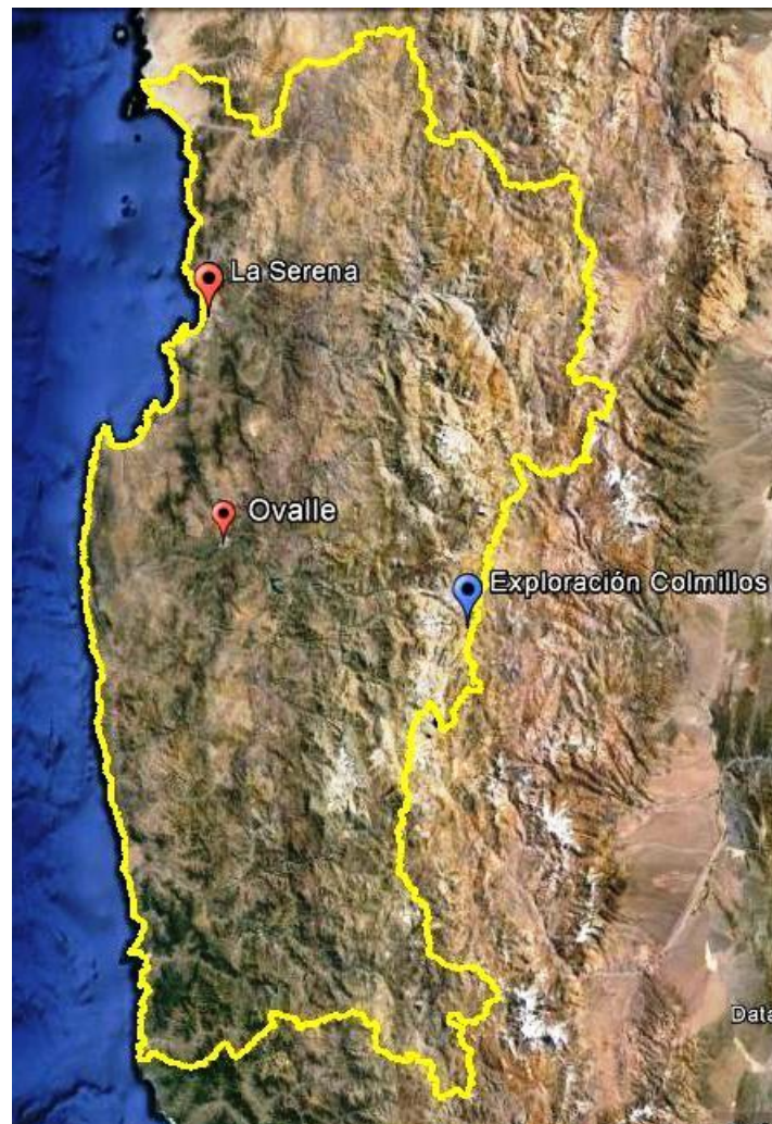
Figura 1. Mapa de Ubicación Regional.