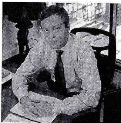
Juan Carlos Monckeberg Fernández Superintendente Superintendencia del Medio Ambiente

Si bien este documento es un material de promoción e incentivo al cumplimiento de la normativa ambiental, y por consiguiente no tiene fuerza normativa, espero que sea una ayuda significativa para los regulados, con miras a promover y obtener el cumplimiento de la normativa ambiental.