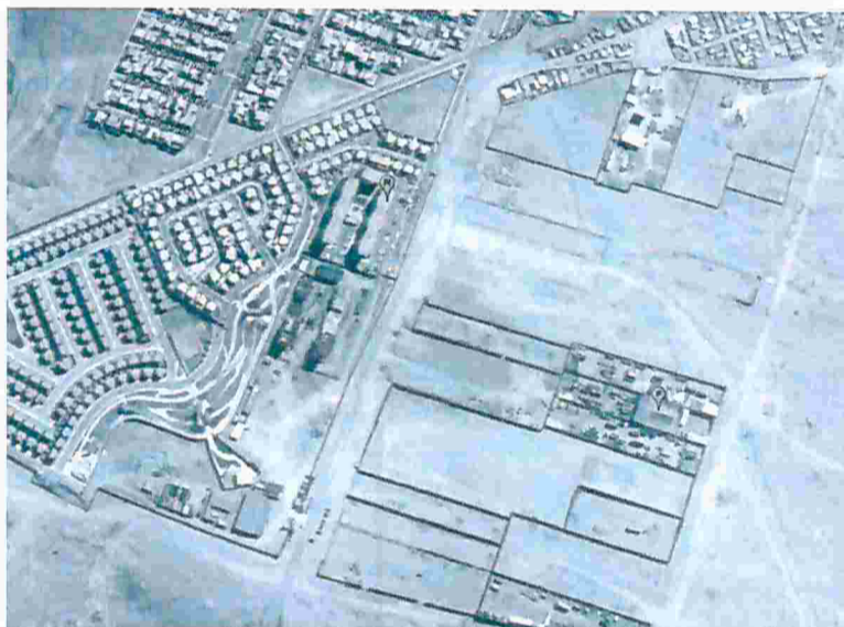
Figura N° 1. Ubicación recepto sensible R1 actividad de fiscalización de fecha 8 de enero de 2017.