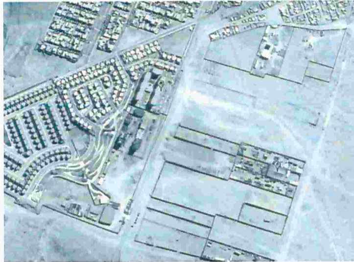
Figura N° 1. Ubicación receptor sensible R2 actividad de fiscalización de fecha 8 de enero de 2017.

Coordenadas receptor. Datum: WGS84, Huso 19s