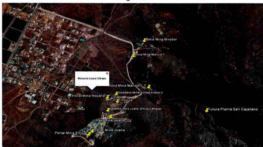
Imagen N° 1

40° Que, la unidad de proyecto, también se evidencia en que los distintos proyectos mineros se encuentran muy cercanos unos de otros, en un mismo paño, insertos dentro de una circunferencia cuyo radio no es mayor a los 750 metros y a una distancia de 258 metros de la población más cercana, según se aprecia en la siguiente imagen: