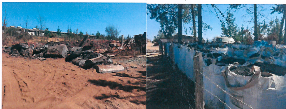
Fotografías N° 3 y 4

50° Que, además DFZ constató en su fiscalización almacenamiento de “materia prima”, en suelo desnudo, no reuniendo las condiciones estructurales y sanitarias para el almacenamiento de una sustancia peligrosa, con clasificación de riesgo clase 6.1, escoria a granel acumulada en suelo desnudo (Fotografía N° 3), así como también derrame de petróleo en suelo desnudo en el área de la instalación donde se ubica el estanque de 7.000 L con petróleo (Fotografía N° 5), y un área de 100 m 2 aproximadamente con acopio de maxisacos con “cenizas de bronce”, a la intemperie expuestos a la lluvia y sol (Fotografía N° 4), tal como se aprecia en las siguientes imágenes: