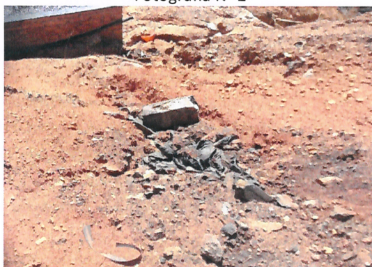
Fotografía N° 2