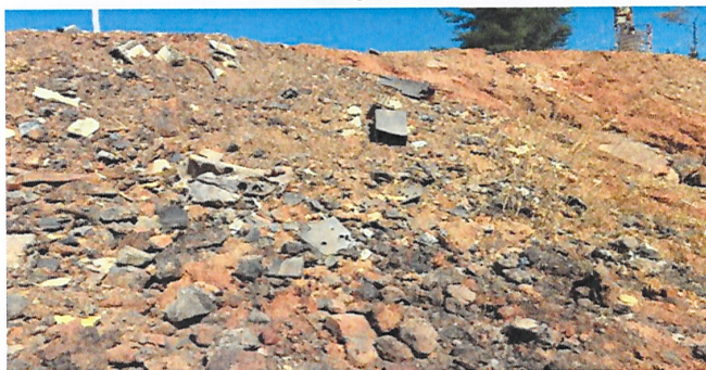
Fotografía N° 1

49° Que, asimismo es dable suponer que la instalación se encuentra generando además los efectos del artículo 11 letra b) de la Ley 19.300: “Efectos adversos significativos sobre la cantidad y calidad de los recursos naturales renovables, incluidos suelo, agua y aire” , toda vez que durante la fiscalización realizada por esta SMA con fecha 14 de marzo de 2018, se constató la presencia de partes de baterías de plomo enterradas en suelo descubierto, sin ningún tipo de tratamiento o manejo, no siendo posible determinar la cantidad de residuos peligrosos dispuestos, tal como se aprecia en las siguientes fotografías: