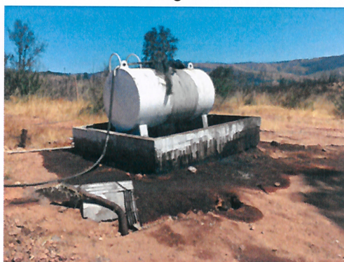
Fotografía N° 5