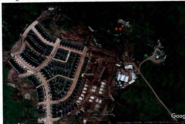
Imagen N° 2: Imagen satelital casas construidas Lote A Desarrollo Inmobiliario Macro Pilauco II

22. Que, por otra parte, se ha ocasionado un daño ambiental que se imputa en este acto de carácter irreparable entendido como la pérdida de información arqueológica y paleo arqueológica irrecuperable del lote A. En efecto, el proyecto se encuentra ya construido, como se visualiza en las siguientes imágenes, por lo que los hallazgos que con alta probabilidad y razonablemente se encontraban en este lugar, no fueron rescatados y consecuentemente no pudo extraerse información asociada a ellos, de ningún tipo: