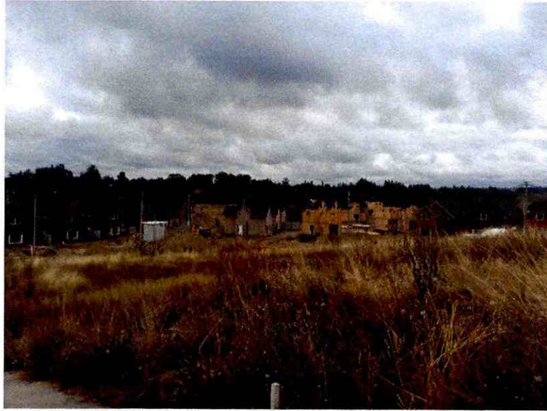
Imagen N° 3: Casas construidas Lote A Desarrollo Inmobiliario Macro Pilauco II