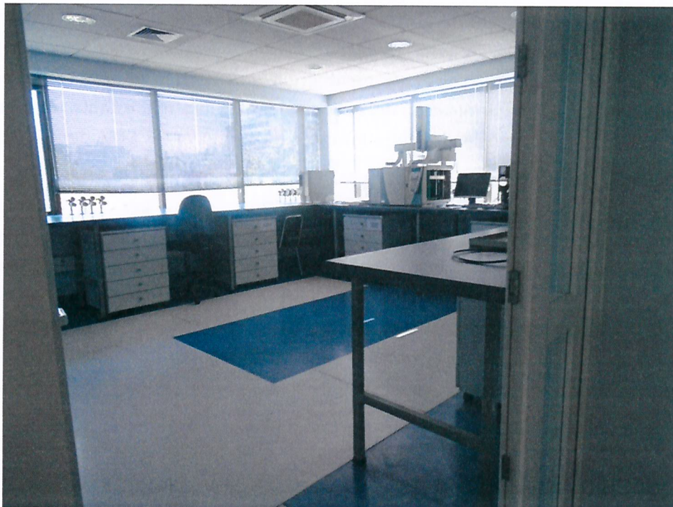
Fotografía 2. Interior Sucre N° 2596, Ñuñoa, con instalaciones vacías