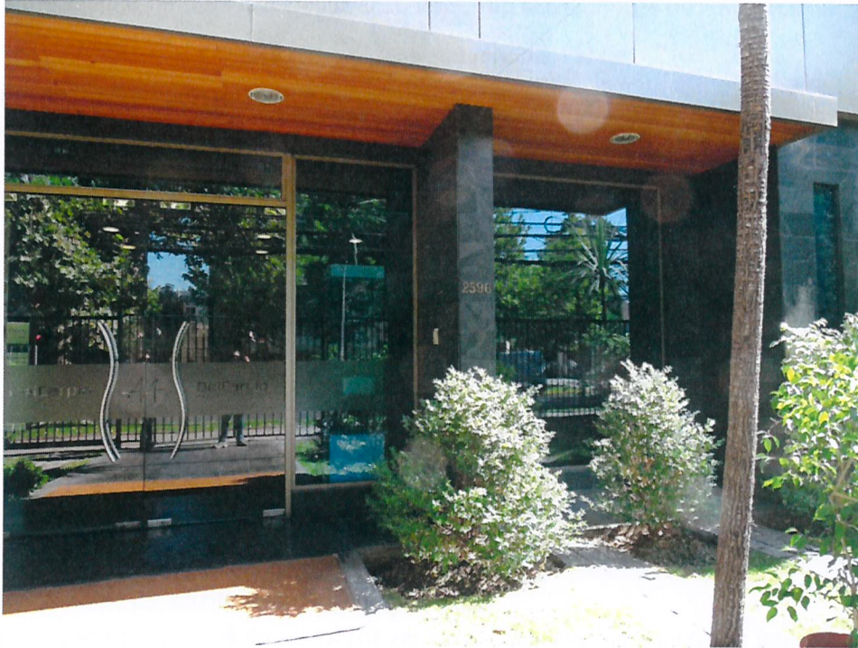
Fotografía 1. Dirección CEA Ltda. Sucre N° 2596, Ñuñoa

Fuente: Anexo N° 2, IFA N° DFZ-2019-153-XIII-RET