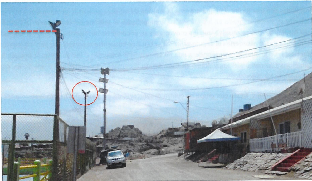
Imagen 4. Alumbrado Público Villa Prat