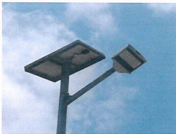
Imagen 3. Luminaria LED con panel fotovoltaico en Calle Arturo Prat