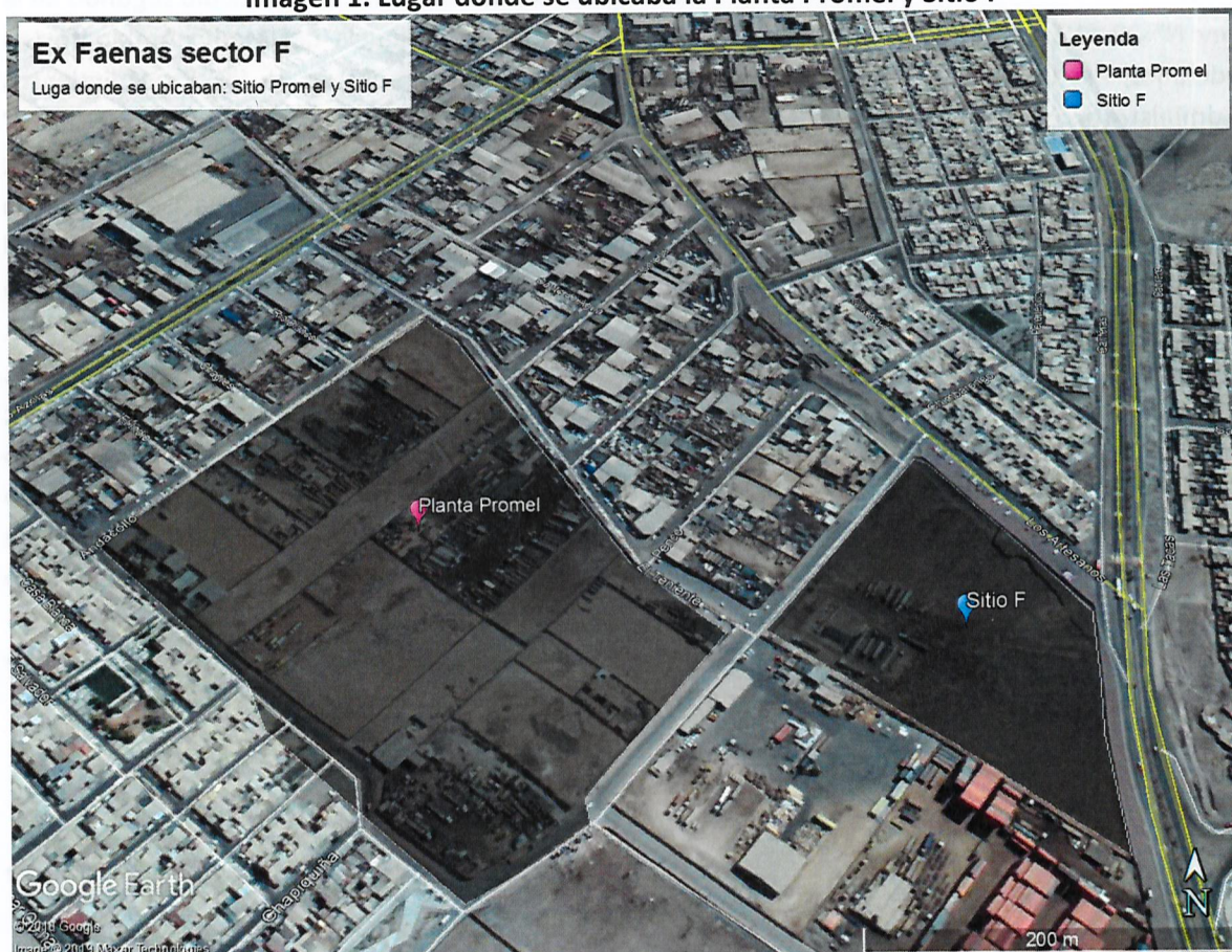
Imagen 1. Lugar donde se ubicaba la Planta Promel y Sitio F