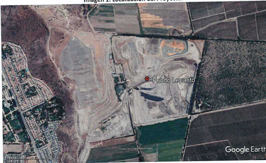
Imagen 1: Localización del Proyecto.