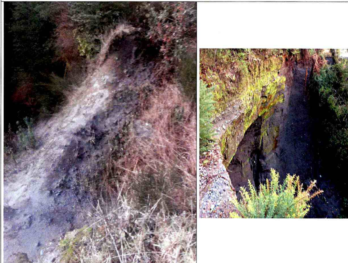
Imágenes 1: Socavón acceso al vertedero y remociones en masa