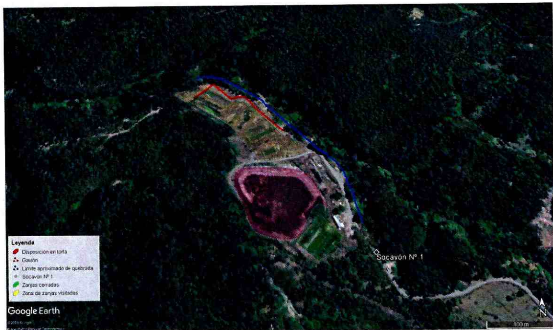
Imagen N° 2: Mapa del proyecto en su estado actual

34. Que, por tanto, producto de la situación en que se encuentra actualmente el vertedero, es razonable sostener que el incumplimiento a las obligaciones de la etapa de abandono ha contribuido, en alguna medida, a la producción de socavones en el sector, máxime considerando que se han dispuesto residuos en zonas cercanas a la quebrada, como se visualiza en las siguientes figuras y como también quedó levantado en las diferentes inspecciones ambientales. En la primera de ellas, se ve la ubicación de las partes del proyecto de acuerdo a lo observado por imágenes satelitales y lo constatado en terreno. Cabe destacar la distancia existente entre la quebrada, el gavión construido por el titular, y la zona de zanjas de disposición visitada durante la actividad inspectiva. Además se observa la dimensión de la torta de residuos, la cual no fue mencionada durante las evaluaciones, como se señalará más adelante. Luego, en la siguiente imagen, se observa el plano del proyecto presentado en la DIA ingresada el año 2007, del proyecto “Regularización de Zanjas de Disposición Final de Lodos”. En ella se agregó indicaciones de las principales partes de acuerdo a lo que se indica en el mismo plano. Cabe destacar que en la zona que se utiliza actualmente para disposición, el titular declaró encontrarse una bodega de bins y la zona de reforestación, y por su parte, la zona donde se ubican las zanjas sería alejada de la quebrada: