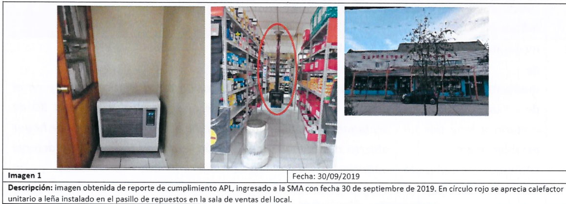
Imagen N° 3: Imágenes contenidas en Reporte presentado por Fecunda Patagonia Limitada