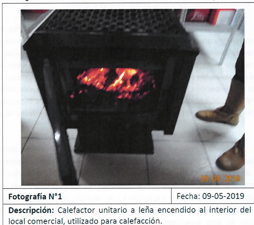
Imagen N° 2: Calefactor a leña encendido en fiscalización de 09 de mayo de 2019