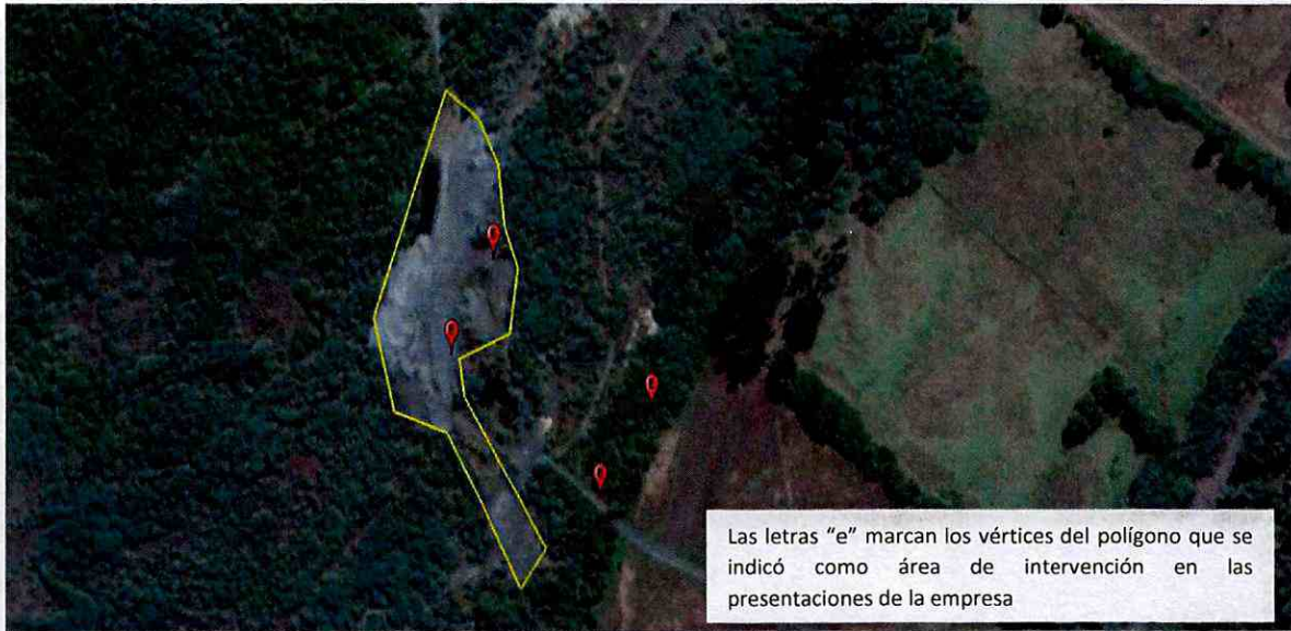
IMAGEN N° 5. SITUACIÓN PREVIA A LA EJECUCIÓN DEL PROYECTO

Superintendencia recurrió a imagen de 2017 (Figura N° 5). En esta imagen es posible apreciar que en dicho momento, el área intervenida correspondía a 8.313 m 2 (0,8 hectáreas), considerándose este punto como la situación base del sector. Lo anterior, se encuentra en concordancia a lo informado por el propio titular al SEA, en su presentación de fecha 29 de noviembre de 2017, que describe la misma área como zona intervenida de forma previa al proyecto (Imagen N° 1).