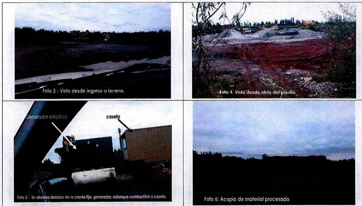
IMAGEN N° 2 FOTOGRAFÍAS TOMADAS POR LA DOH EN ACTIVIDAD DE INSPECCIÓN DE 08 DE MAYO DE 2019

16. Que, sin perjuicio de lo anterior, consta también que en actividad de inspección realizada por funcionarios de la DOH, el día 08 de mayo de 2019, la empresa aún se encontraba realizando actividad de extracción de áridos en el lugar, lo que se desprende de las siguientes fotografías remitidas por dicha autoridad.