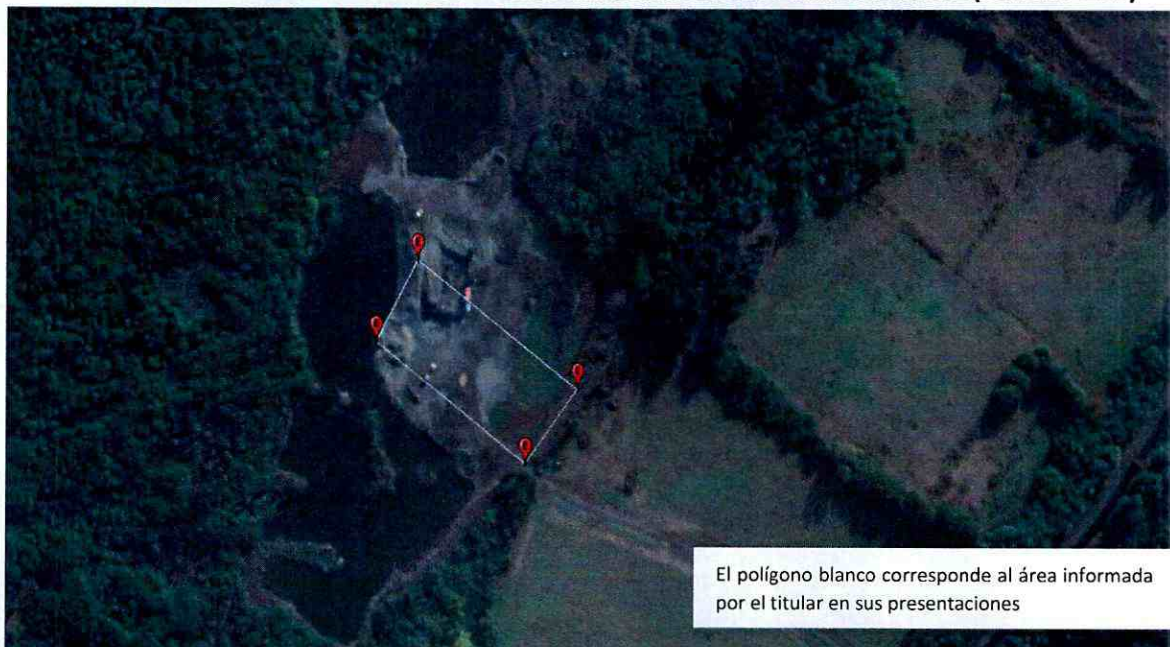
IMAGEN N° 4. POLÍGONO DE EXTRACCIÓN PRESENTADO ANTE EL SEA Y ÁREA DEL LOTE 2 (ROL 307-156)

20. Que, por otra parte, en lo que respecta a la titularidad de las áreas afectadas por el proyecto, se desprende del documento de consulta de pertinencia de ingreso al SEIA y del plano asociado al levantamiento topográfico lote 2, que los polígonos establecidos en ambos documentos no se condicen con la zona efectivamente intervenida por el proyecto. Lo anterior, se visualiza en la imagen N° 4.