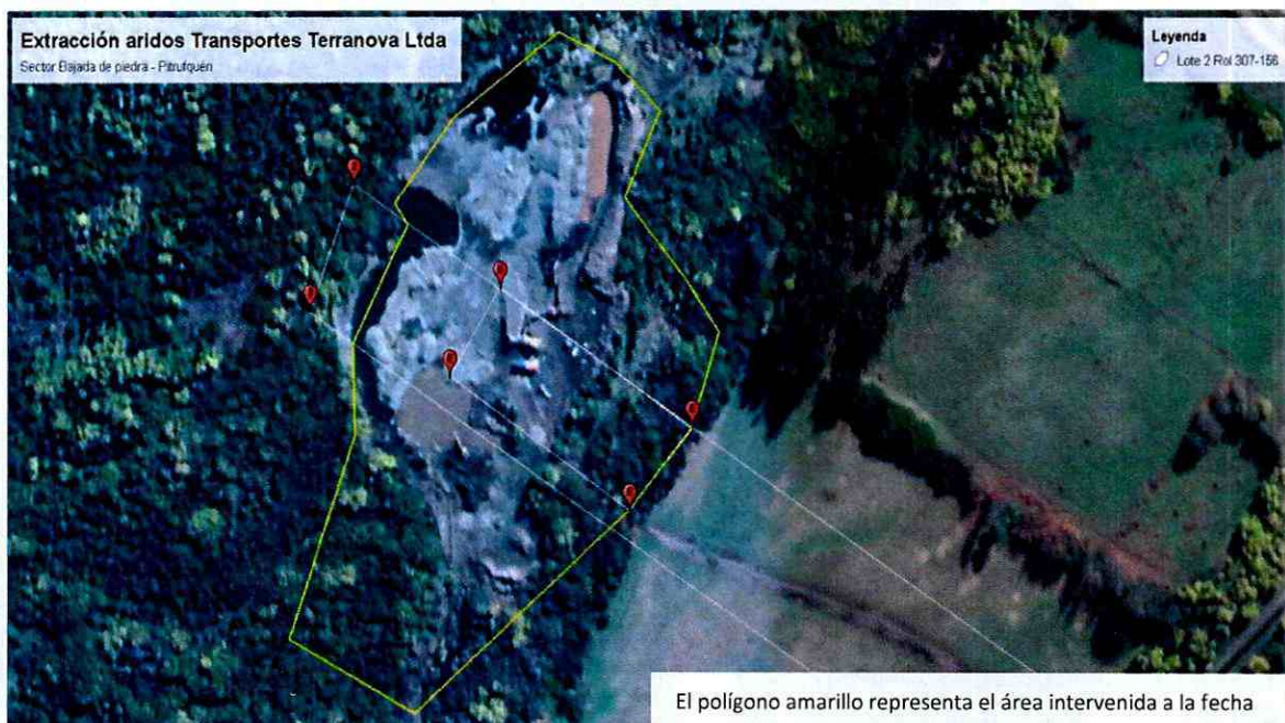
IMAGEN N°3. SITUACIÓN DEL ÁREA INTERVENIDA A AGOSTO DE 2018