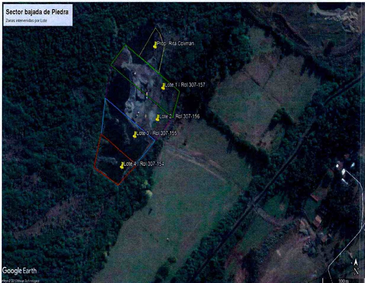
IMAGEN N° 7. PERÍMETROS DE ZONAS INTERVENIDAS EN LOS LOTES NO AUTORIZADOS

23. Luego, y en cuanto a lo denunciado por don Luis Alberto Ferrada Ibáñez, es posible apreciar que el área de intervención del proyecto no se limitó al área informada al SEA o al área del Lote 2 Rol 307-156, que se indicó como área de intervención en solicitudes realizadas al SEA y a la Ilustre Municipalidad de Pitrufquén, sino que por el contrario se extendió sin autorización a los predios colindantes Lote 1 Rol 307-157, Lote 3 Rol 307-155, Lote 4 Rol 307-154 y Lote de propiedad de Rita Coliman, afectando el suelo, la flora y vegetación presentes en dichas áreas. Lo anterior se grafican en la siguiente imagen.