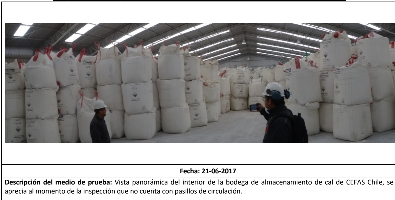
Imágenes N° 1, 2 y 3 – Disposición de maxisacos en las instalaciones de CEFAS

10.2. En la bodega fue posible observar el almacenamiento de maxisacos en pilas cuya altura variaba entre 3 y 4,5 metros, adosados a los muros de la bodega y sin pasillos de circulación ni pasillos secundarios.