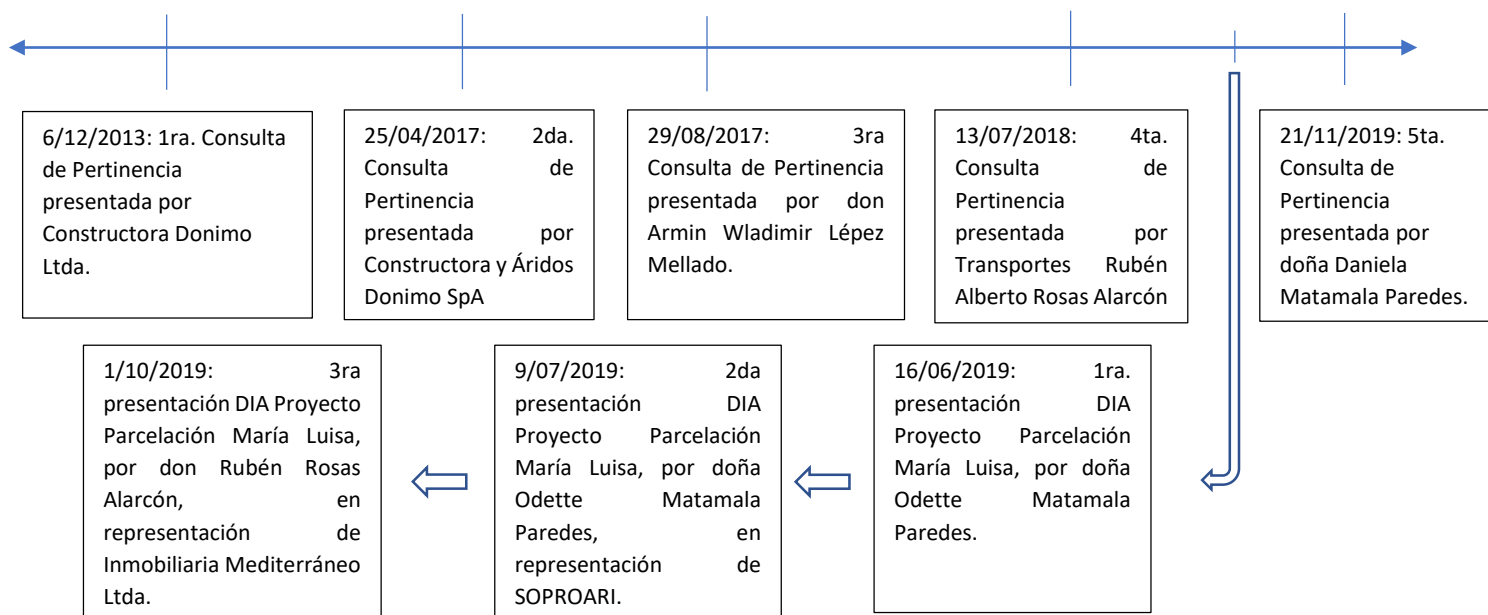
Imagen N°3: línea cronológica de actividades ingresadas al SEIA

Asimismo, seg n lo ya expresado, el SEA de la Regi n de la Araucan a se ha pronunciado sobre lo anterior, mediante Res. Ex. 329 y Res. Ex. 304 determinando la existencia de una actividad extractiva continua asociada a la Parcelaci n del Predio Rol N  301-7, en una superficie mayor a 5 ha. (el subrayado es nuestro) en predios contiguos y de mismo due o, que a juicio de la SMA conforma una sola extracci n, lo que da cuenta de la existencia de obras, partes y acciones DIA que vinculan a los proyectos de extracci n materializados y en desarrollo en las diferentes parcelas del rol matriz.