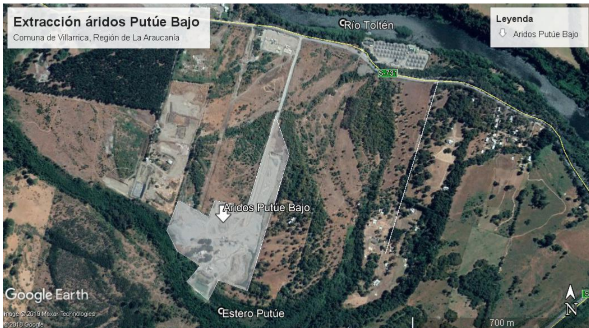
Imagen N°2: plano de ubicación de faenas de extracción de material pétreo en sector Putúe