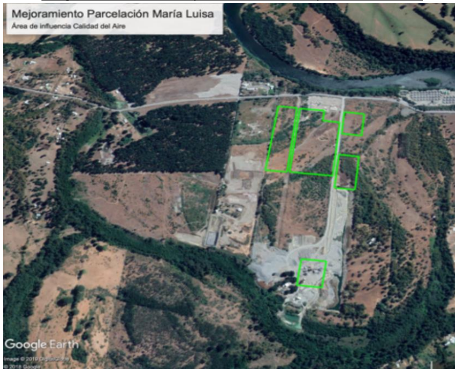
Imagen N° 7: Área de emplazamiento del Proyecto María Luisa