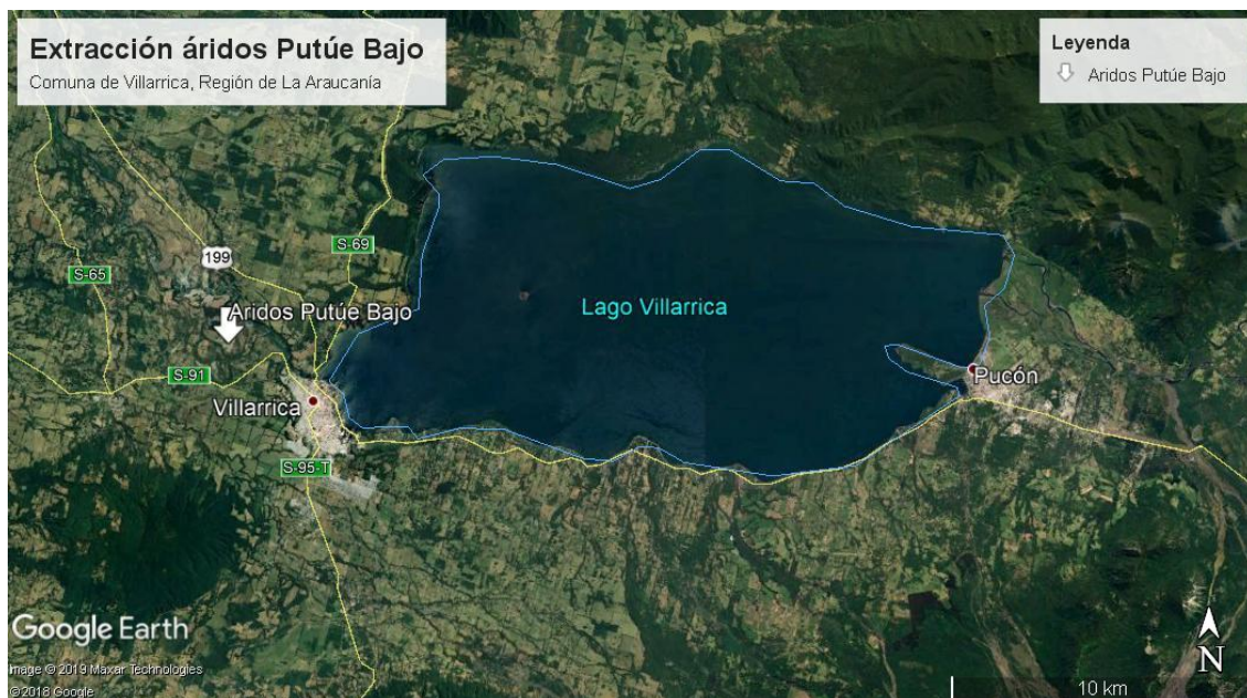
Imagen 1: ubicación del proyecto Extracción Áridos Putúe Bajo