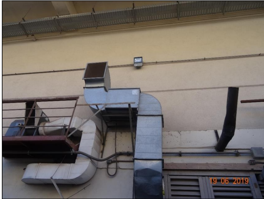
Imagen 2. Vista general Luminaria N° 6, sector patio de descargas Tottus.