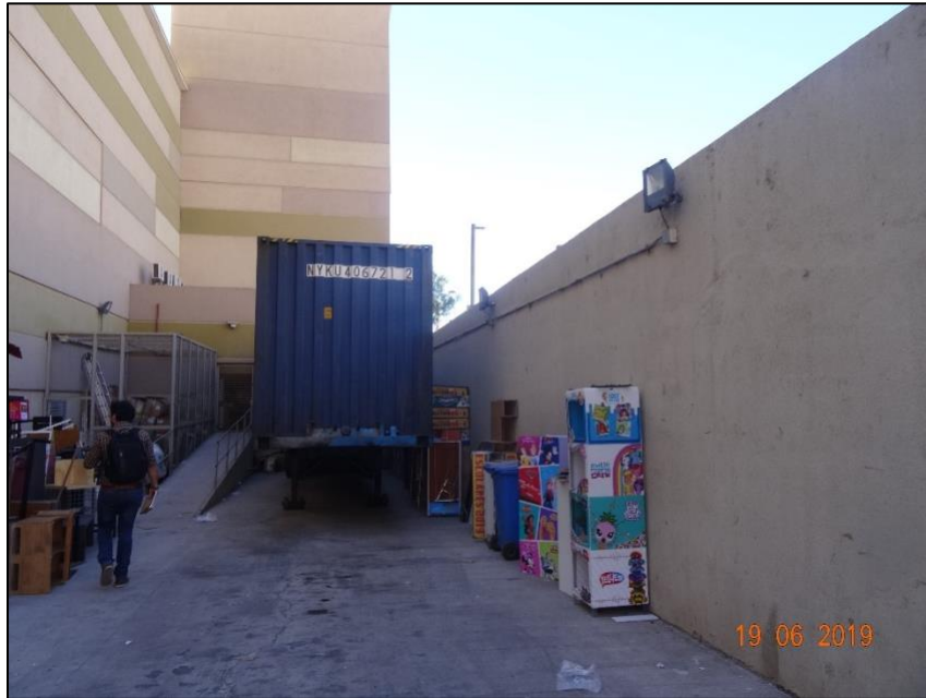
Imagen 4. Vista general Luminaria N° 7, sector patio de descargas Ripley.