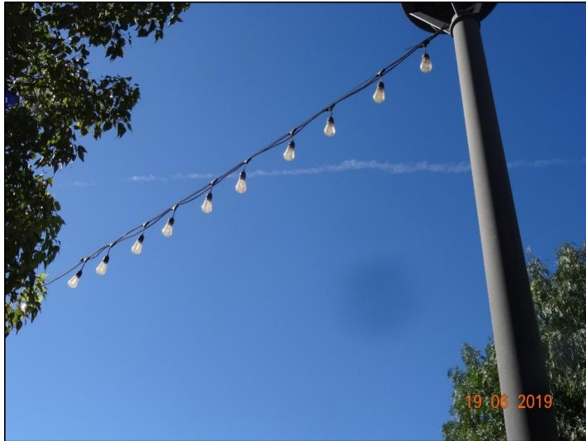
Imagen 6. Vista general Luminaria N° 8, sector Ripley.