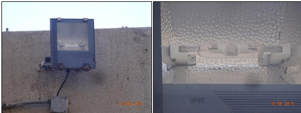
Imagen 5. Acercamiento Luminaria N° 7.