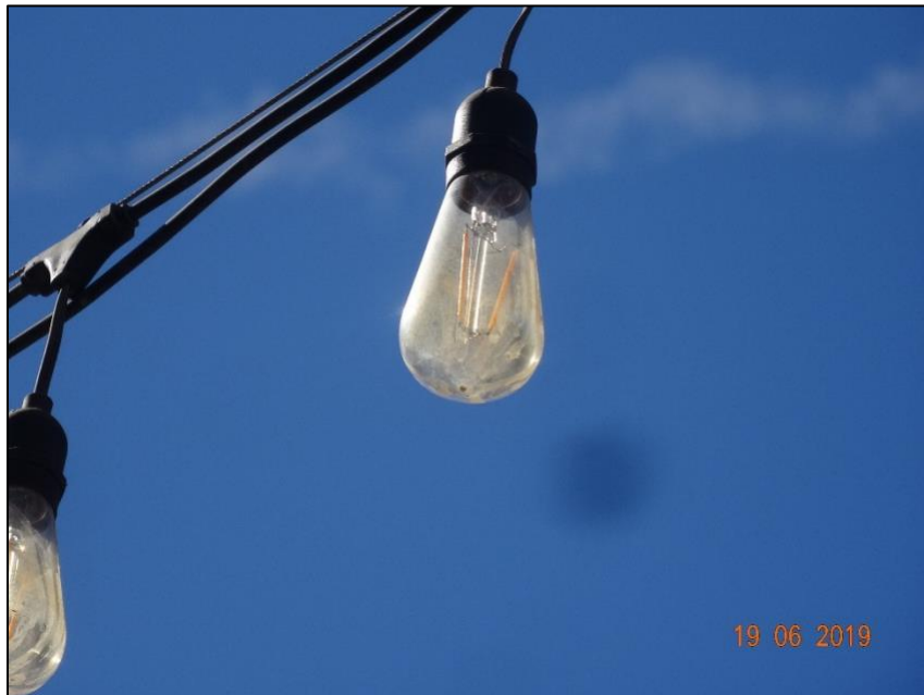
Imagen 7. Acercamiento Luminaria N° 8.