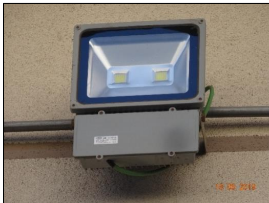
Imagen 3. Acercamiento Luminaria N° 6.