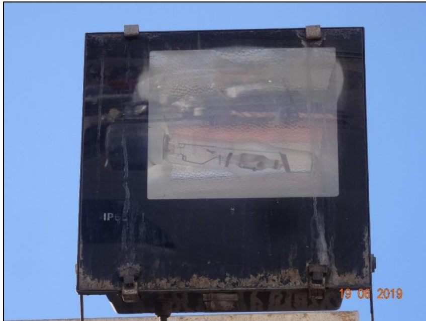
Imagen 5. Acercamiento Luminaria N° 4.