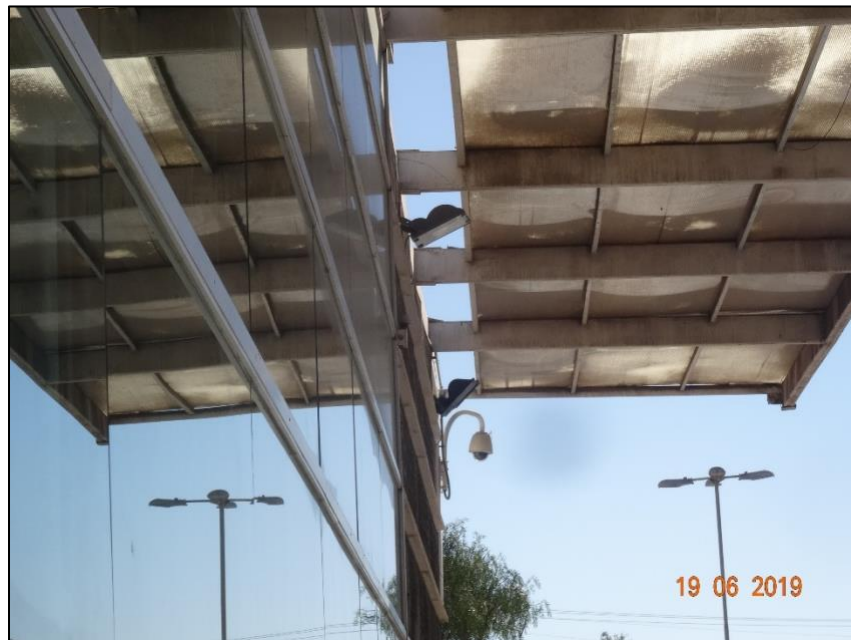
Imagen 2. Vista general Luminaria N° 3, sector vías peatonales – patios.