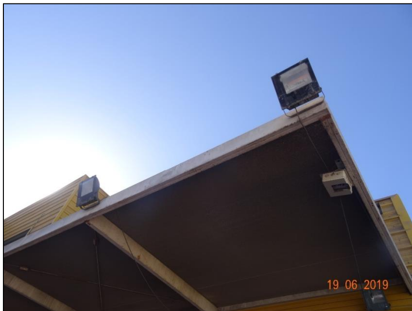
Imagen 4. Vista general Luminaria N° 4, estructura Homecenter.