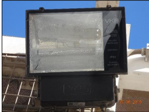
Imagen 3. Acercamiento Luminaria N° 3.