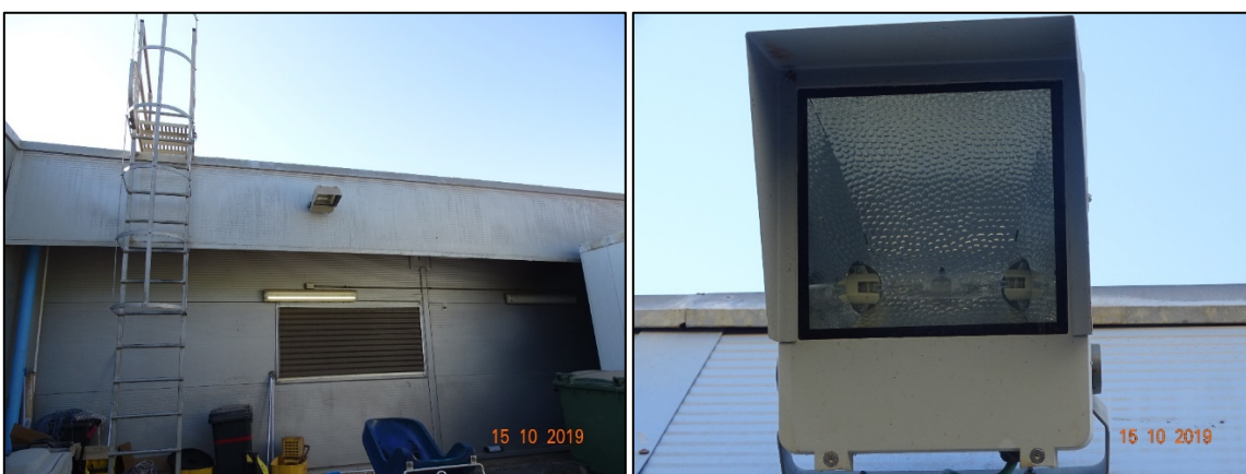
Imagen 2. Luminarias SAP en patio de equipos, identificadas como luminarias 6.