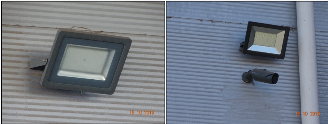
Imagen 3. Luminarias LED en patio de camiones, identificadas como luminarias 8 y 9.