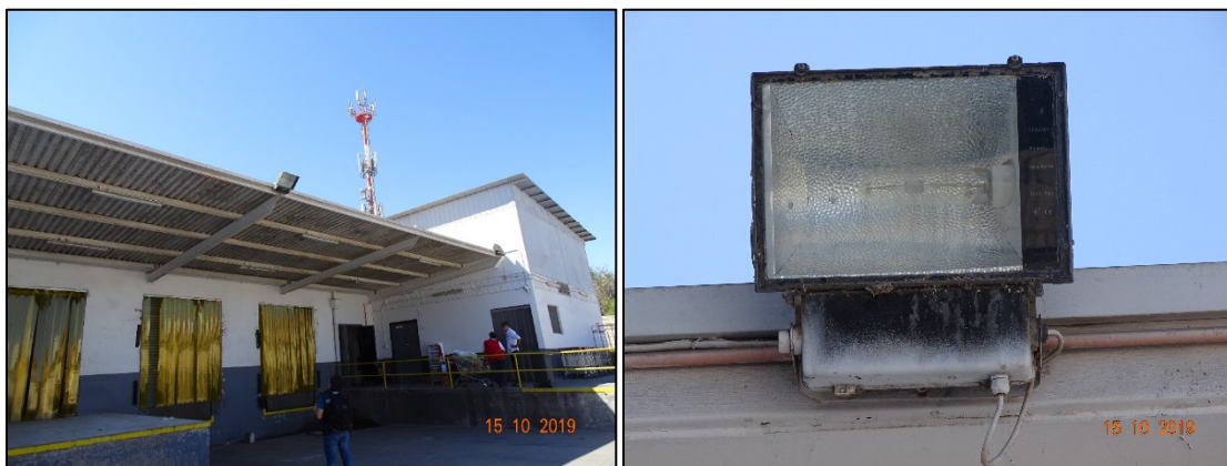
Imagen 3. Luminarias en patio de carga, identificada como luminaria 8.