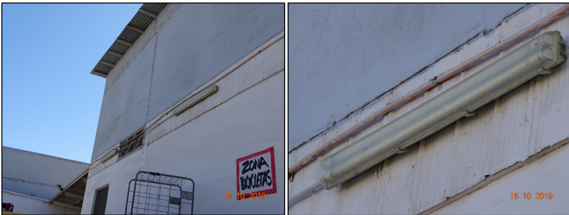
Imagen 2. Tubos fluorescentes identificados como luminaria 7.