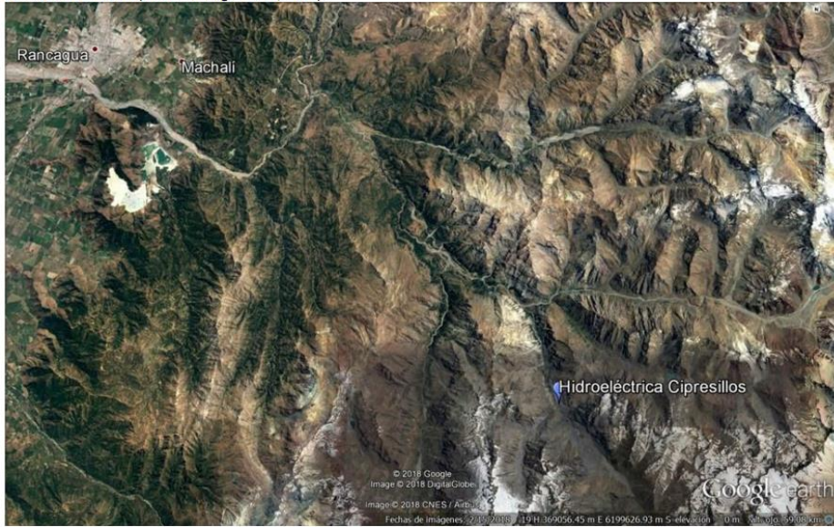
Figura 1. Mapa de ubicación local.

Coordenadas UTM de referencia: DATUM WGS 84