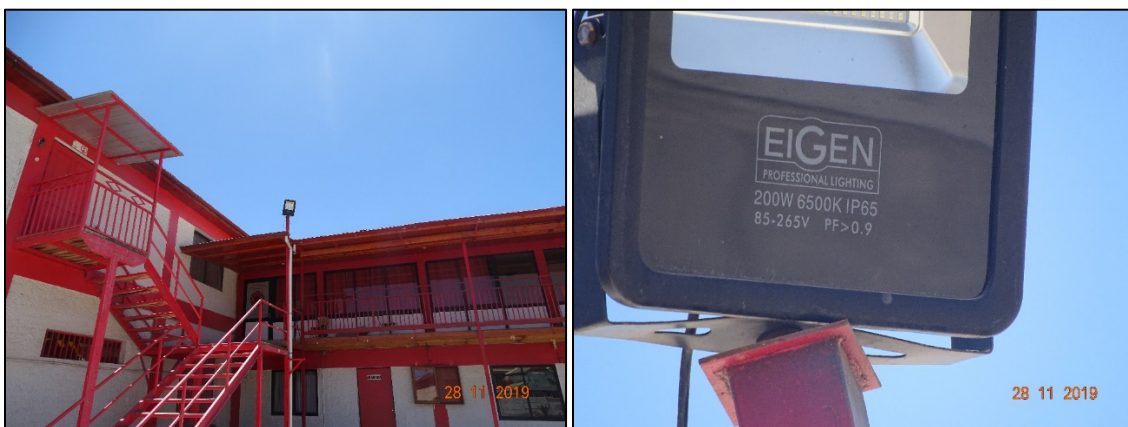
Fotografía 2. Luminaria EIGEN 200W en instalaciones del Cuerpo de Bomberos de Andacollo