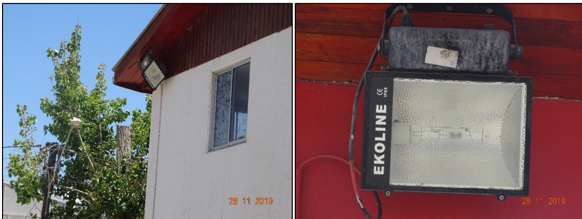
Fotografía 1. Luminaria EKOLINE en instalaciones del Cuerpo de Bomberos de Andacollo