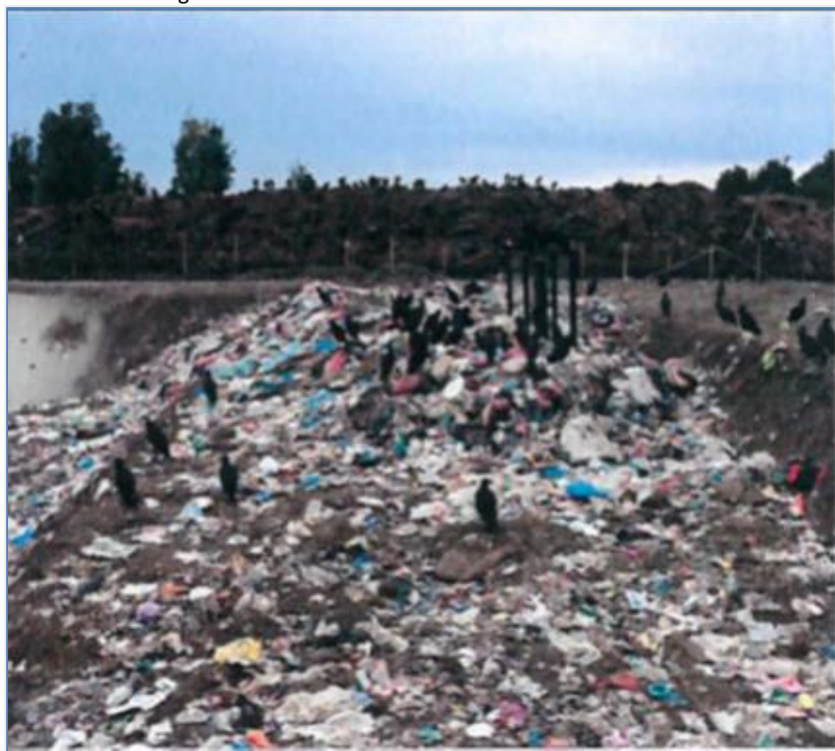
Fotografía N°1: Presencia de aves sobre residuos sin cobertura.