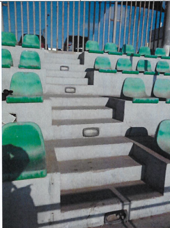
Imagen 3. Luminarias de ahorro de energía ubicadas empotradas a los escalones de las graderías. (Luminaria 4)