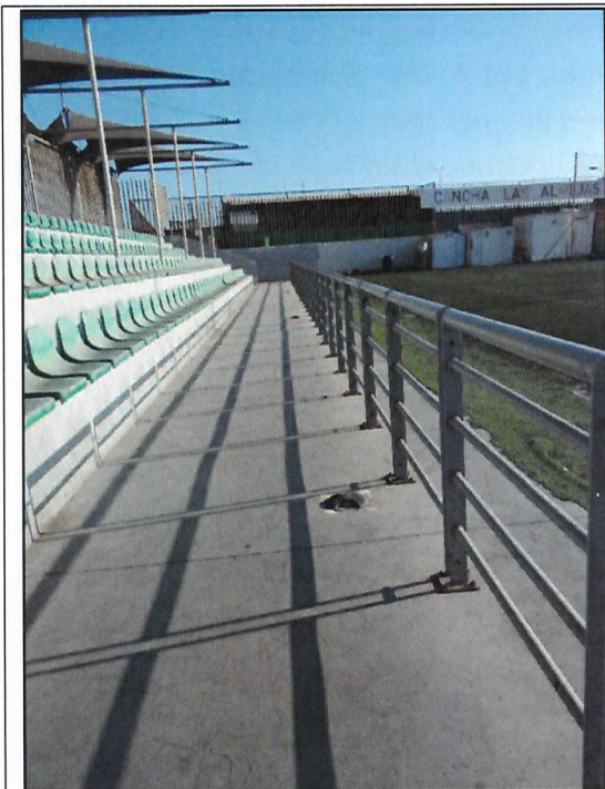
Imagen 1. Luminaria ubicada en el piso de las graderías. (Luminaria 3)