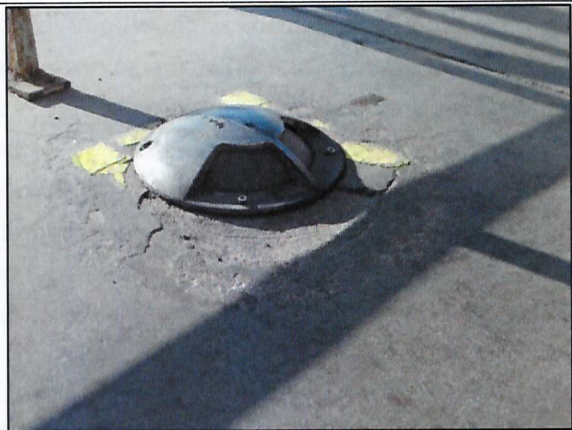
Imagen 2. Detalle de luminaria ubicada en el piso de las graderías (Luminaria 3)