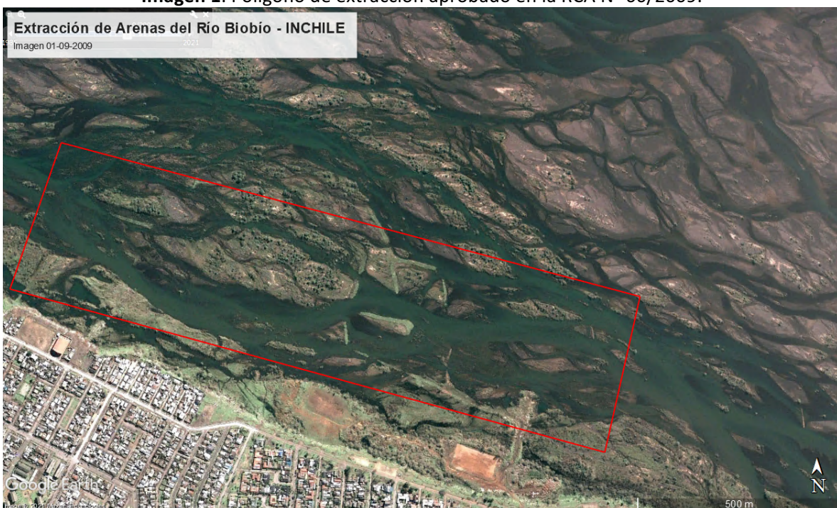
Imagen 1. Polígono de extracción aprobado en la RCA N° 60/2009.