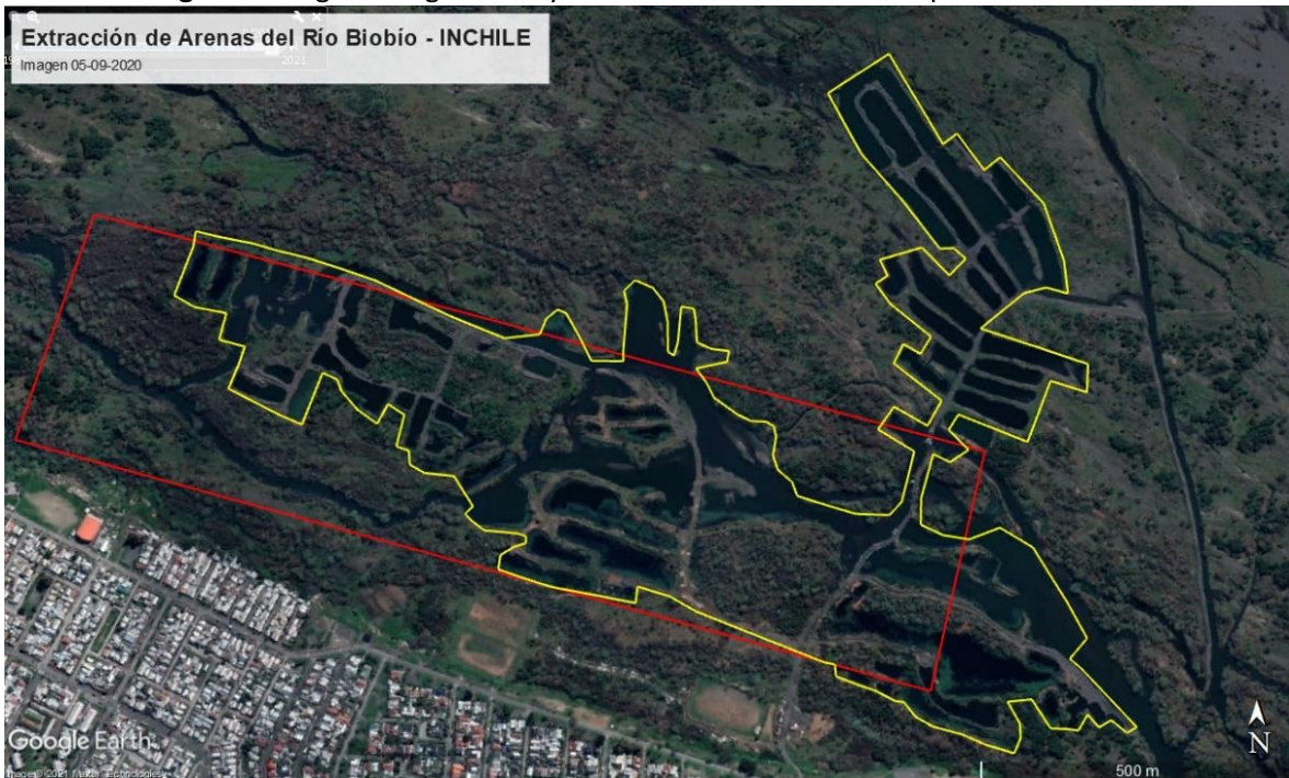
Imagen 3. Imagen Google Earth y área intervenida al 05 de septiembre de 2020.