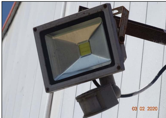
Imagen 4. Vista general luminaria con tecnología LED y sensor de movimiento 6 .