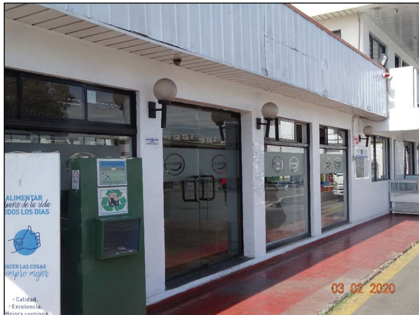
Imagen 2. Vista general luminarias en pasillo principal, tipo farol 4 .