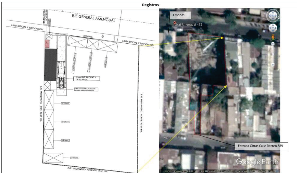
Figura 4 Fuente: DIA "Edificio General Amengual" – Google Earth. Descripción del medio de prueba: Se observa plano de instalaciones de faenas comparado con las oficinas e instalaciones de faena constatadas en la inspección ambiental, ubicadas en calle General Amengual 472 y calle Recreo 389.

Fuente: Informe de Fiscalización DFZ-2019-1468-XIII-RCA