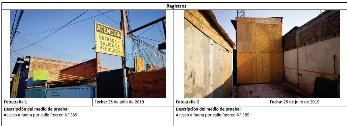
Fotografía 1. Fecha: 25 de julio de 2019 Descripción del medio de prueba: Acceso a faena por calle Recreo N° 389. Fotografía 2 Fecha: 25 de julio de 2019 Descripción del medio de prueba: Acceso a faena por calle Recreo N° 389.