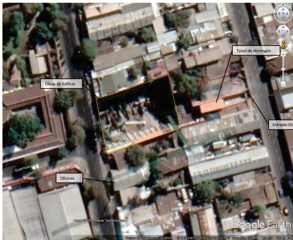
Imagen 1: Layout del Proyecto

13° A partir de los hallazgos constatados en el IFA DFZ-2019-1468-XIII-RCA, particularmente, en base a la visita inspectiva de 29 de julio de 2019 y examen de información acompañada por el titular en presentación de fecha 8 de agosto de 2019, se pudo constatar que la instalación de faena, un túnel de hormigón y una entrada alternativa del Proyecto se encuentran en un domicilio cercano a la obra, ubicado en calle General Amengual N° 472 y que el acceso a la obra se realiza por la propiedad colindante al oriente del Edificio, ubicado en calle Recreo N° 389. De esta manera, al comparar el plano de instalaciones de faenas, disponible en el Anexo 12.3 de la DIA, se observa que en la evaluación se tenía contemplado el emplazamiento de las instalaciones de faena e instalaciones auxiliares dentro de la propiedad General Amengual 392 - 480 – 358, detectándose que las instalaciones cotejadas en terreno no formaron parte de la evaluación ambiental del proyecto , tal como se desprende de las siguientes imágenes: