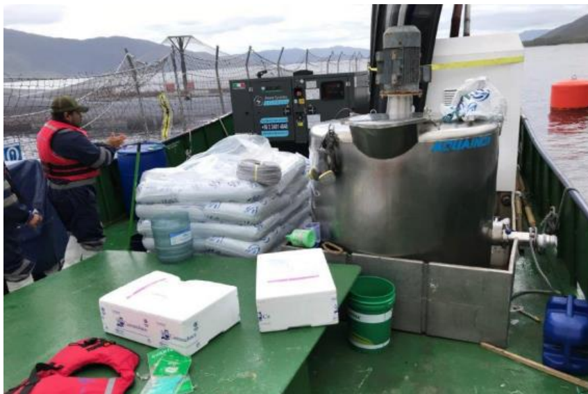
Imagen N°1: Vista general de embarcación Doña Ana PMO 6697, utilizada como procesamiento y almacenaje de mortalidad del CES Punta Alta, RNA 110599.