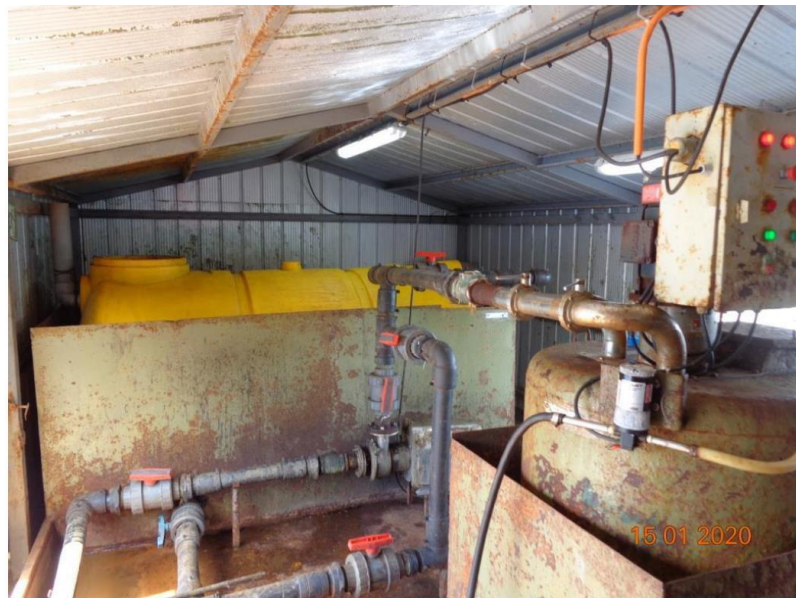
Imagen N°1: Vista general del ensilaje del CES Amparo Chico