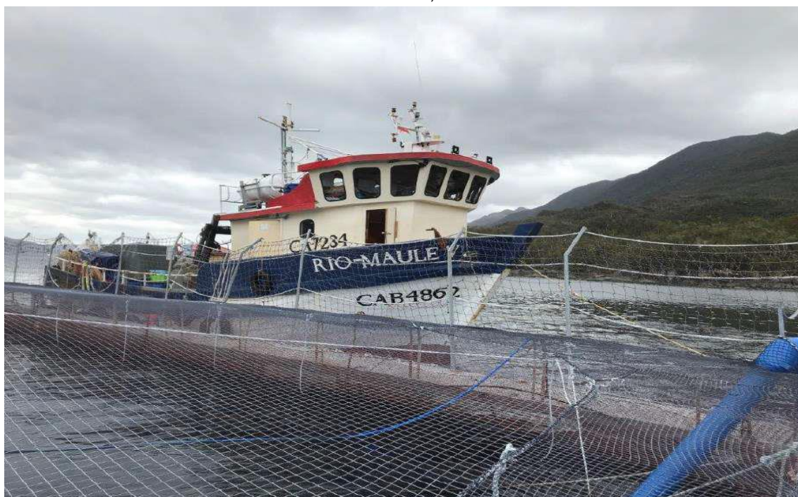
Figura 3: Vista general de embarcación Río-Maule CAB4862, utilizada como procesamiento y almacenaje de mortalidad en el centro Puerto Róbal, RNA 110755.