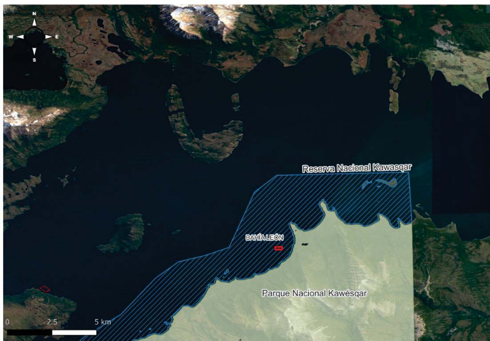
Imagen N° 1: Ubicación de la Unidad Fiscalizable