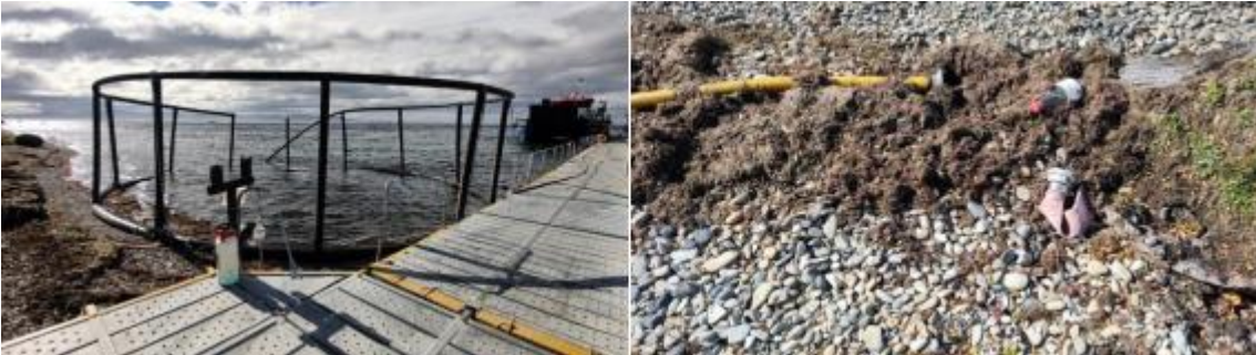
Imagen N° 2: Basura y acopio de materiales en playa, aledaña al CES SKYRING 6