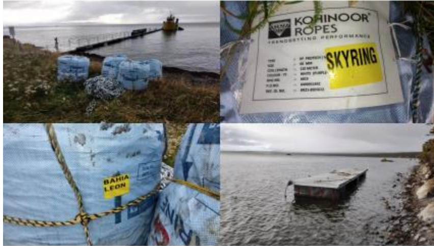
Imagen N° 4: Basura y acopio de materiales en playa, aledaña al CES SKYRING 9