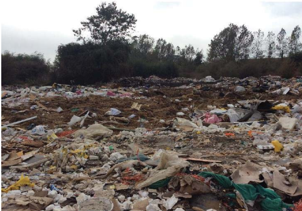
Imagen 2. Vista general del relleno y vertedero