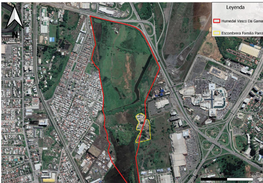
Imagen 4 y 5. Layout del Proyecto.

31° El área que se ha considerado intervenida directamente por el Proyecto en el humedal, que representa en principio 2,47 hectáreas (3,88% del sitio prioritario) se puede graficar a través de la siguiente imagen satelital, utilizando la cartografía del sitio prioritario para la conservación de la biodiversidad, en que se incluye el humedal: