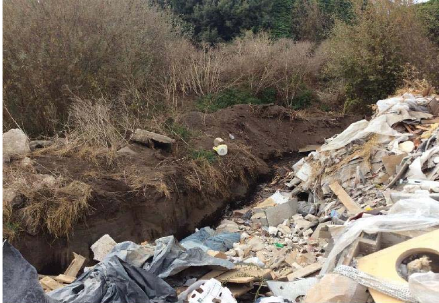
Imagen 1. Construcción de zanja y escape de terreno del humedal.