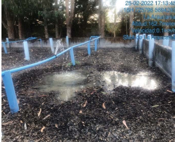
Imagen 1. Acumulación de aguas servidas en el lecho del módulo de lombrifiltros.