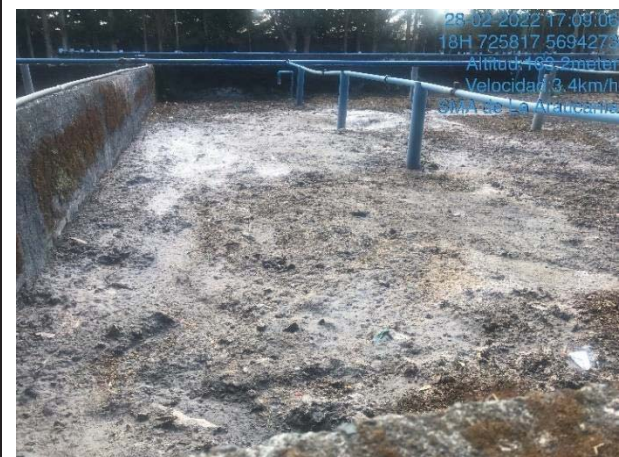
Imágenes 3 y 4: Acumulación de residuos sobre el lecho del módulo de lombrifiltros, donde se aprecia costra grisácea que se descompone y genera un foco de malos olores.