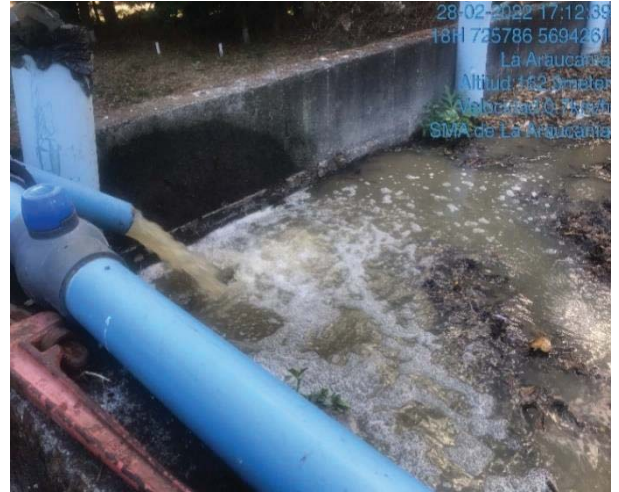
Imagen 2. Sistema de riego mediante chorros, inundando lecho del módulo de lombrifiltros.