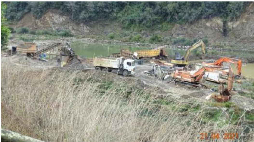
Imagen 7. Constatación de maquina chancadora dentro del predio.