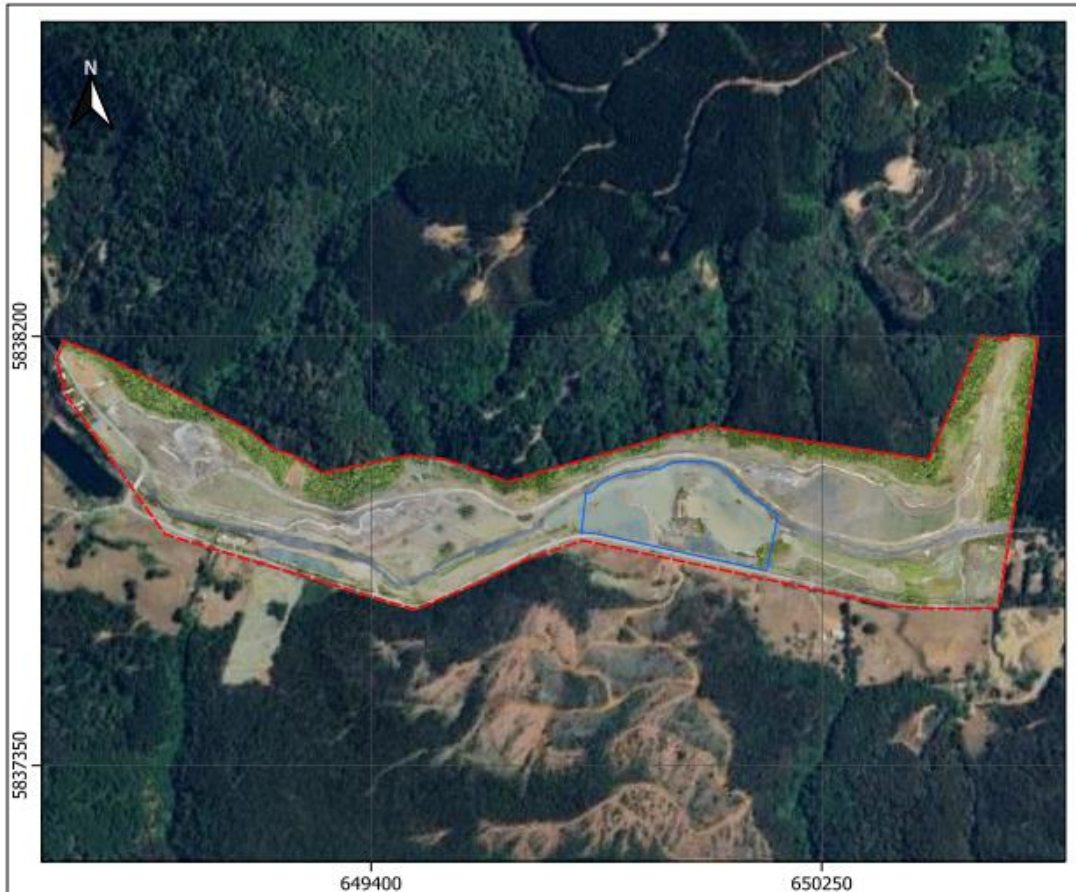
Imagen 3. Información geoespacial del área intervenida por el proyecto, correspondiente al predio Rol N° 205-168, que se encuentra dentro de la línea azulada