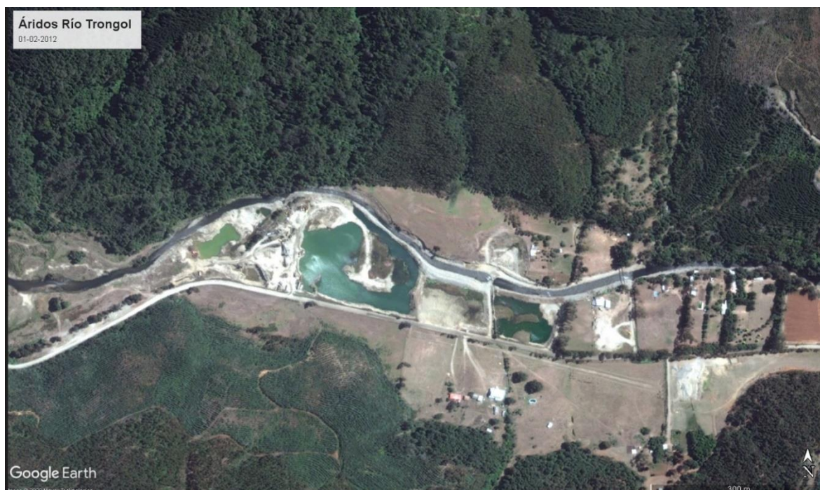
Imagen 2. Imagen satelital de fecha 1 de febrero de 2012

18° En ese contexto, y para efectos de determinar desde cuándo comenzó a producirse el hecho infraccional, se examinó el registro de la primera imagen satelital de Google Earth disponible, posterior a la fecha de inicio de actividades de la empresa en el SII -6 de enero de 2012-, obteniendo como resultado la siguiente imagen: