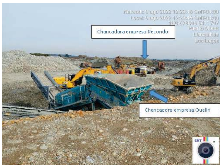
Imagen 2. Constatación de máquinas chancadoras en la UF