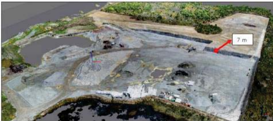
Imagen 3. Profundidad promedio de extracción