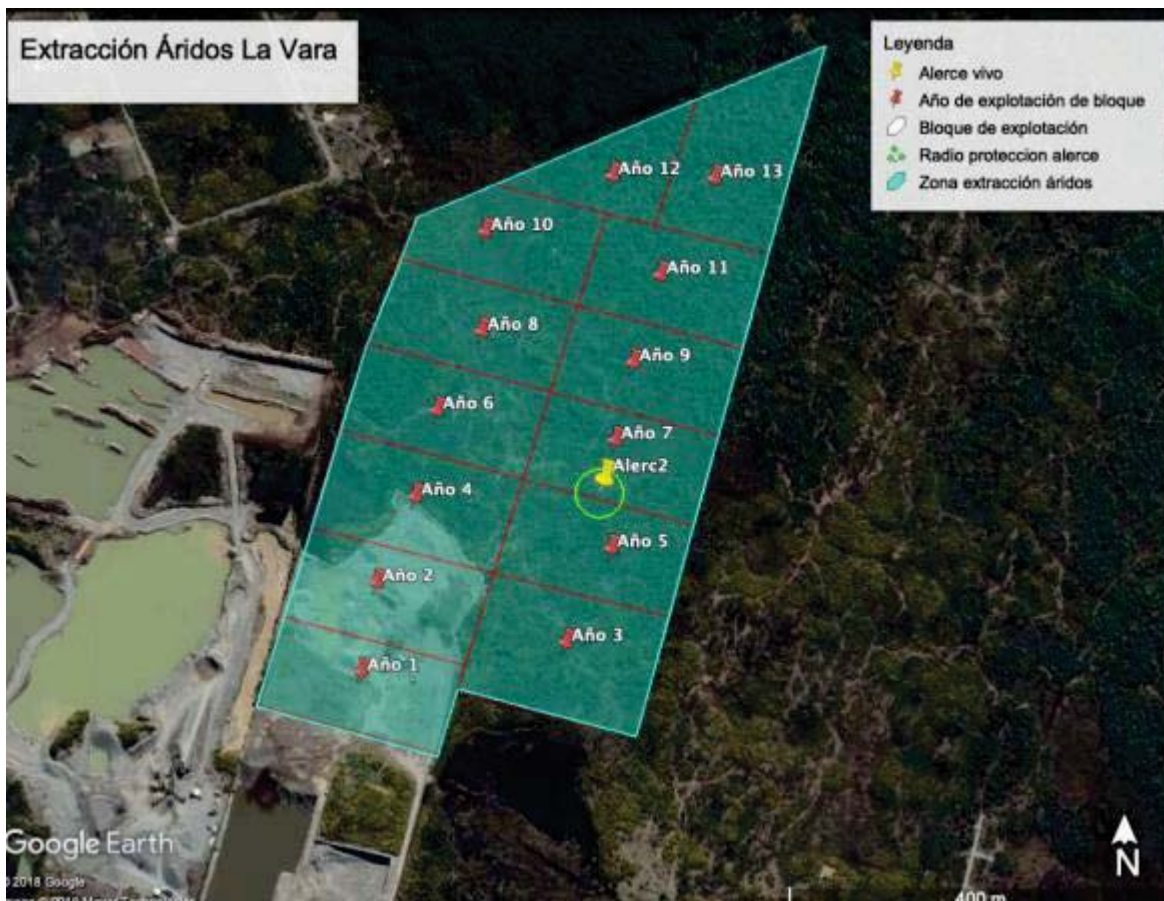
Imagen 1. Layout del Proyecto